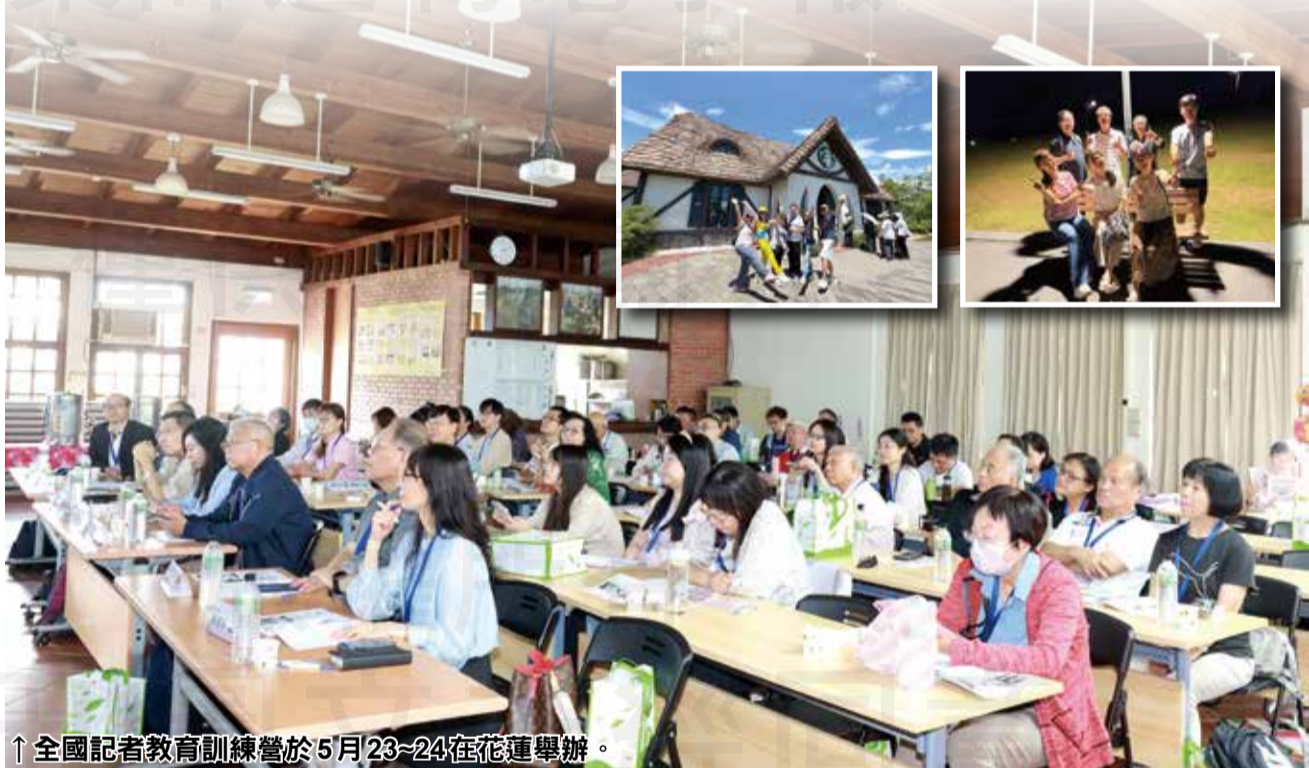
↑ 全國記者教育訓練營於5月23~24在花蓮舉辦。

種光的來源，包括順光、逆光、側光，要充分應用光線，才能精準對焦，而不失焦。在室內拍照時，要注意投影機的光線是否關掉，以免產生色差，且構圖要乾淨，避免背景的干擾。他提醒，若要投稿藥師週刊，建議優先拍橫式照片，方便後續編排運用。