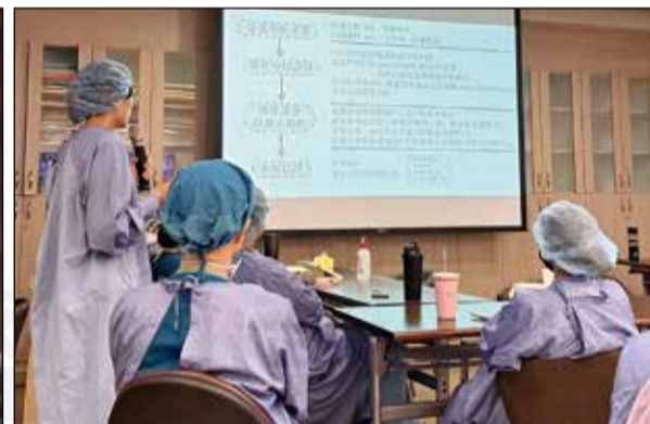
↑左圖為個案師帶個案至藥物諮詢室作藥物諮詢，藥師於術前階段針對病人進行用藥整合。中、右圖為藥師參與ERAS團隊會議並說明藥事照護執行流程。