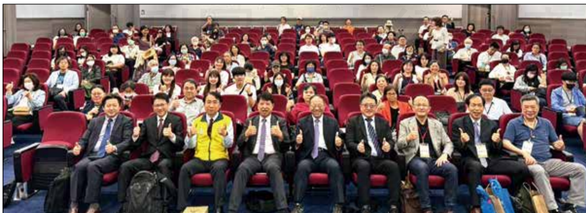
↑「漢方醫養研討會」共同探討漢方醫養在未來健康照護體系的發展方向。