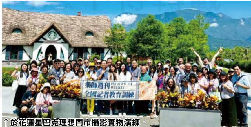
↑於花蓮星巴克理想門市攝影實物演練。

故事屋的咖啡店，被靜謐的湖畔環繞著，湖面倒映著藍天白雲，讓記者們實務演練所學的攝影技巧；為期兩天的訓練營稍縱即逝，最後在花蓮火車站各自返回所在縣市，期許為之後出刊的藥師週刊，增添新的火花與靈感！