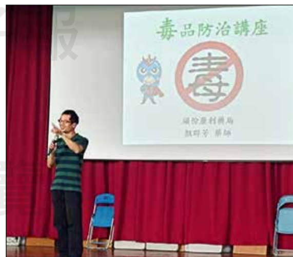
↑ 藥師至國中進行反毒宣導。

若發現身旁朋友有異常的舉動，像是精神亢奮、神情渙散、有偷竊的行為，都需提高警覺，另外也可尋求反毒專線0800-770885（請請你，幫幫我）的協助，引導受困者脫離毒癮，重新找回自由的靈魂。