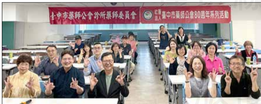
↑臺中市藥師公會診所委員會於3月27日第一次會議。