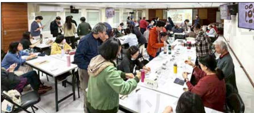
↑臺北市藥師公會辦理「中藥知能提升」講座。