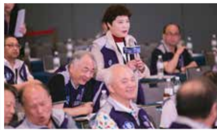
↑ 與會幹部熱烈討論&精彩活動合影。

全聯會的目標：協助各執業類別的藥師，在急難救助系統完成相關的認定訓練，而參與介入的方式是以急救站為切入點，藥品供應站為目標，或者是與其他單位的聯合協助，這些都是需要所有的藥師一起參與討論跟規劃完成。