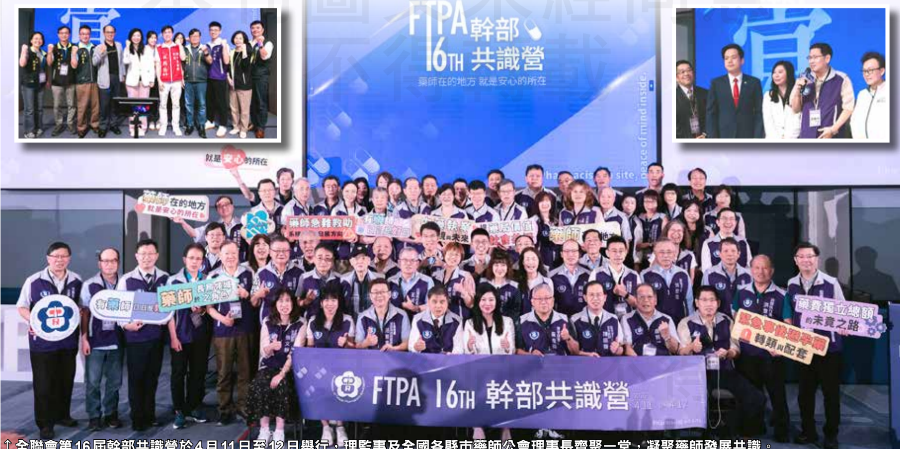
↑全聯會第16屆幹部共識營於4月11日至12日舉行，理監事及全國各縣市藥師公會理事長齊聚一堂，凝聚藥師發展共識。

黃金舜強調，藥師作為用藥管理的專業核心，應持續升級與轉型，積極投入慢性病管理、用藥安全及長照整合等領域，拓展專業價值與服務深度，方能在快速變動的醫療環境中穩固專業地位、引領制度發展。