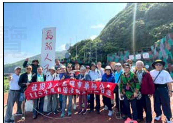
↑高雄市藥師公會於3月28~30日舉辦自強活動「宜蘭龜山三日遊」。