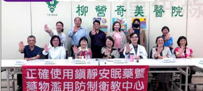
↑「精進在地化正確使用鎮靜安眠藥暨藥物濫用防制衛教模式計畫」專家共識會。