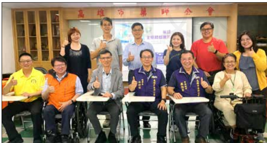
↑高雄市藥師公會於3月21日宣布成立「新聞媒體中心」。