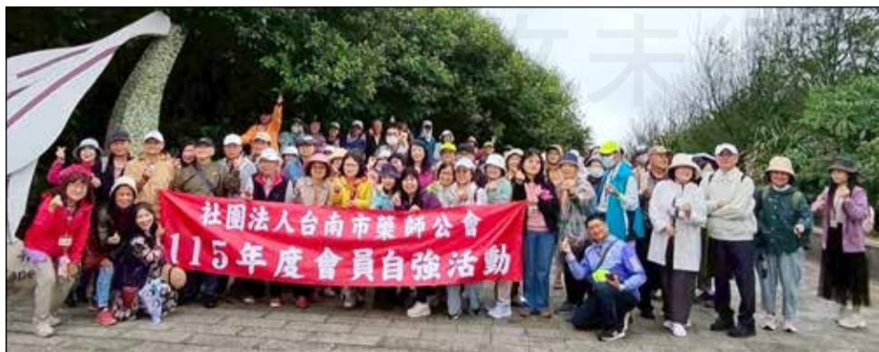
↑台南市藥師公會於3月28~29日舉辦「龍洞灣岬步道、老梅綠石槽二日遊自強活動」。