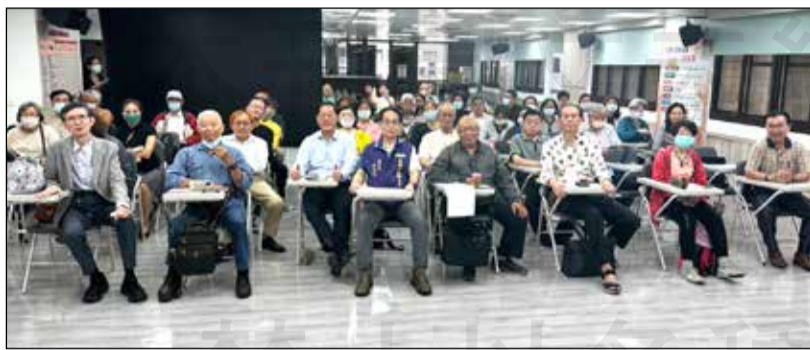
↑ 高雄市藥師公會於3月18日舉辦「AI智慧藥事服務應用：衛教短片拍攝與製作技巧」智慧讀書會。