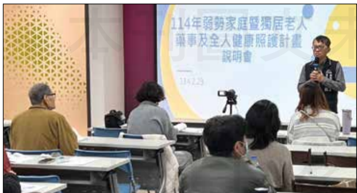
↑臺中市食藥處於2月23日舉辦「弱勢家庭暨獨居老人藥事及全人健康照護計畫」說明會。