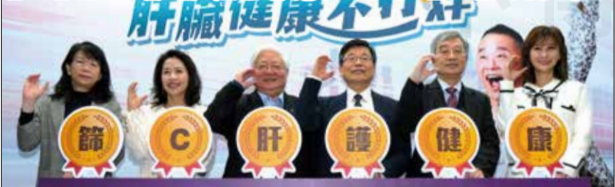
↑國健署於3月18日辦理「C肝篩檢有成效 肝臟健康不打烊」記者會（左三圍國健署長吳昭軍）。

【本刊訊】國民健康署於3月18日辦理「C肝篩檢有成效 肝臟健康不打烊」記者會，並發布「消除C肝最後一哩路！主動篩檢 積極治療 治癒率近99%」。為預防感染B、C型肝炎病毒而罹患肝病，國民健康署自109年起擴大提供45至79歲民眾（原住民提前至40歲）免費終身1次B、C肝篩檢，透過補助金額調升、轉介獎勵及特定族群快篩等策略提升篩檢成效。全國已有超過6千家醫療院所投入B、C肝篩檢服務，攜手消除C肝。國健署強調，若發現自身或親朋好友C肝抗體檢查結果為陽性或不確定，立即主動接受進一步診斷，確保及早獲得適當治療。若確診為C肝者，健保將全額給付C肝口服藥物，治癒率近99%。