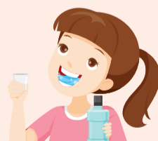
rinse [rɪns] 沖洗（用清水）