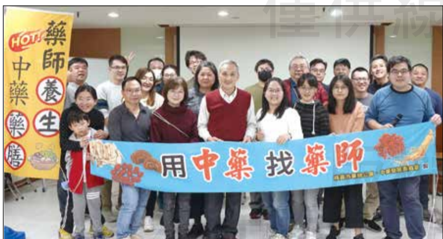
↑桃園市藥師公會舉辦「常見中藥藥膳介紹及銷售技巧」課程。