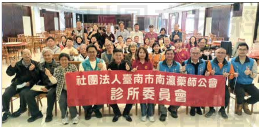
↑台南市南瀛藥師公會舉辦「中藥漢方養生座談會」。