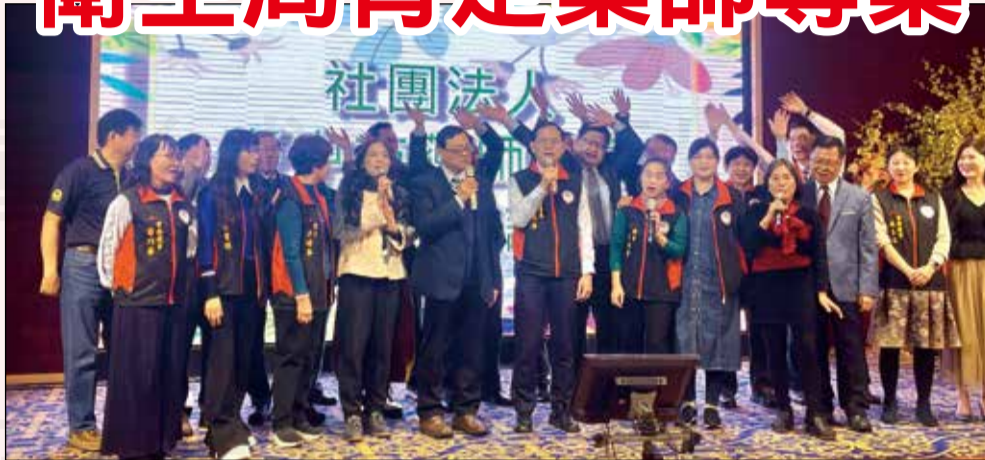
↑臺中市藥師公會於2月23日舉辦114年度幹部新春聯歡晚會。