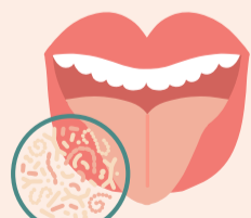
oral thrush [ˈɒrəl θrʌʃ] 鵝口瘡