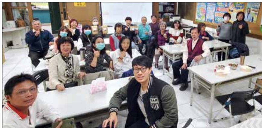
↑嘉義市藥師公會舉辦冬季進補課程。