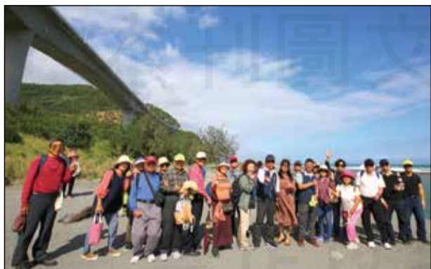
↑台南市藥師公會舉辦資深藥師台東金崙泡湯之旅。