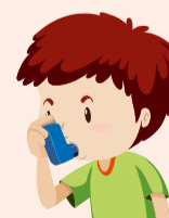
spacer [ˈspeɪsə] 輔助器

Inhaled corticosteroids for asthma treatment may lead to oral thrush . Rinsing mouth after inhalation or using an inhaler spacer may help reduce side effects.