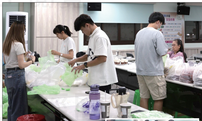
↑藥師與藥學實習生將中藥材分包裝袋的現場。