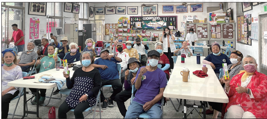
↑台東藥師在東興部落文化健康站和參與講座的民眾合影。