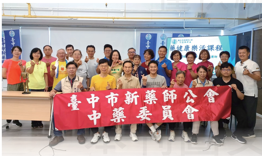
↑臺中市新藥師公會舉辦一系列「藥健康樂活課程」。