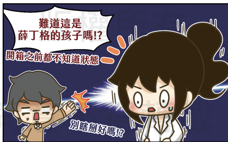
既期待又怕受傷害，應該是很多父母產檢共同的心聲