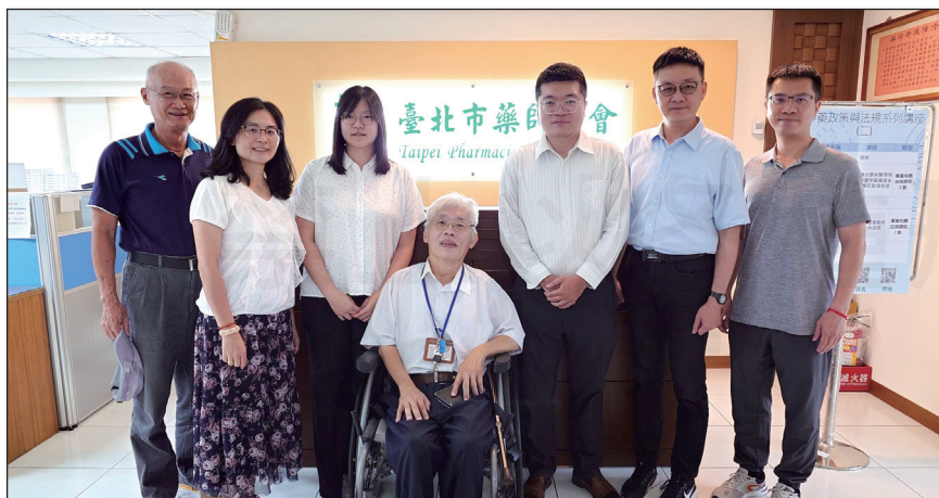
↑臺北市藥師公會舉辦113年度最後一場中藥法規繼續教育課程。