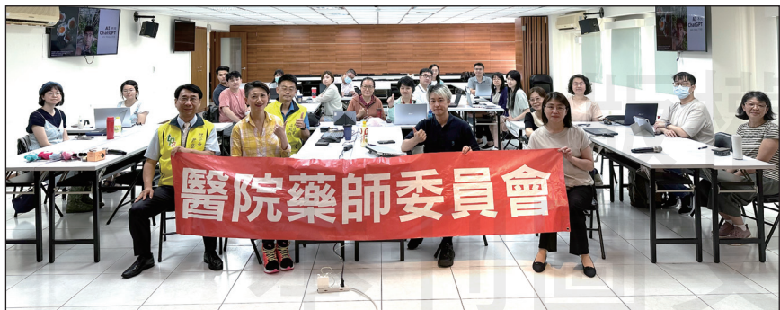
↑臺北市藥師公會於9月14日舉辦「藥師職場AI力」實作工作坊。