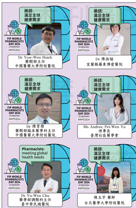
↑台灣藥師響應FIP慶祝世界藥師日活動。