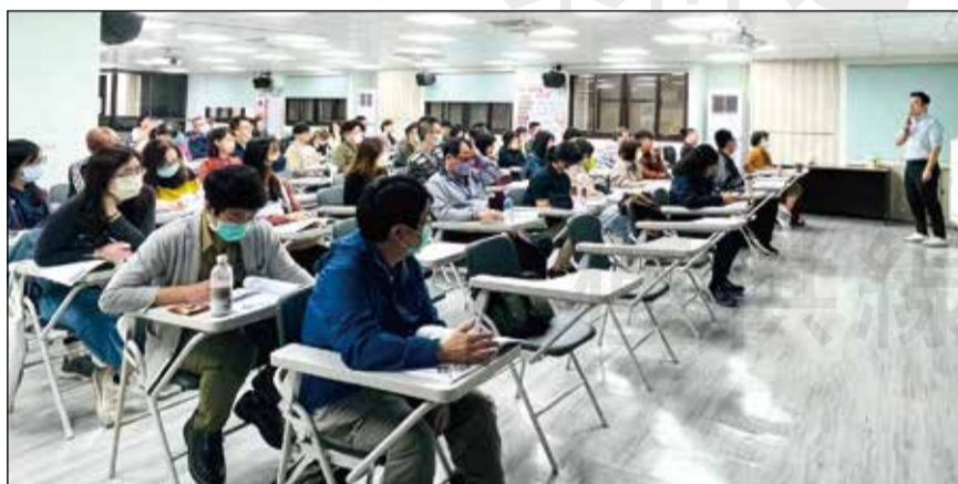
↑「運動禁藥諮詢藥師認證課程」南區場系列課程於12月9日舉辦進階課程。