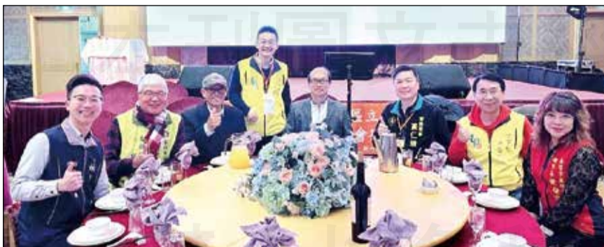
↑新竹市藥師公會於112年12月27日承辦「藥師公會北部七縣市幹部聯誼會」，力挺藥師進立法院。