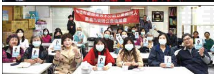
←嘉義市藥師公會於112年12月21日成立後援會。