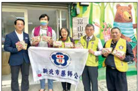
↑新北市藥師公會公益促進委員會於112年12月20日展開寒冬送暖活動。