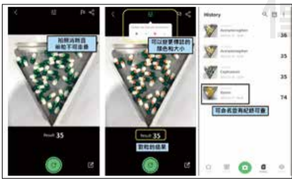
↑「Pilleye-tablet, pill counter」APP畫面。