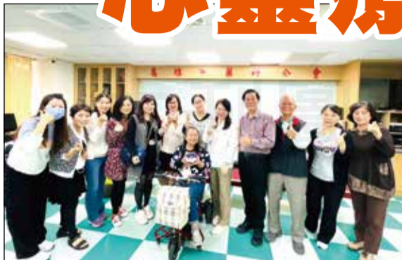
↑ 高雄市藥師公會社區藥局與診所委員會攜手合辦「果凍花手作」活動。