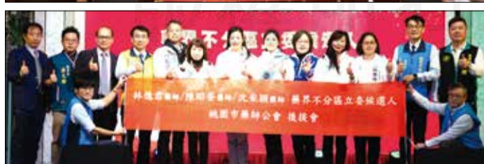
←桃園市藥師公會於112年12月24日成立桃園市藥師公會後援會。