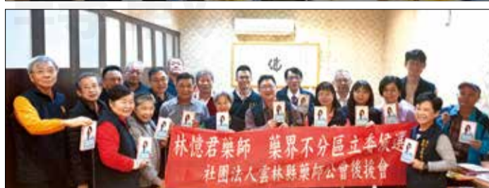
←雲林縣藥師公會於112年12月24日成立藥界不分區立委候選後援會