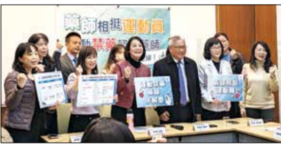
↑立委吳思瑤於112年12月25日舉辦「運動禁藥諮詢藥師記者會」。理事長黃金舜指出，藥師公會在體育署的支持下，112年開始進行「運動禁藥諮詢藥師」培訓與認證。

【本刊訊】2024巴黎奧運在即，年底有12強棒球賽，台灣運動健將為國爭光，精彩賽事令人動容，藥師除為其加油外，更希望能發揮專業成為運動員的好夥伴。