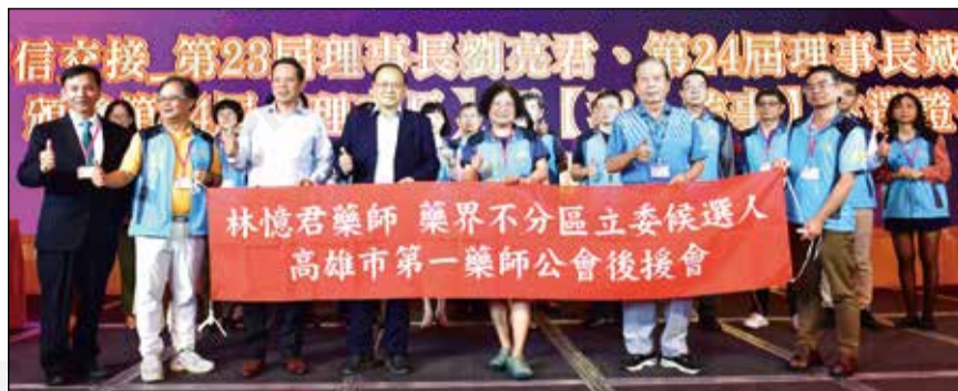
↑112年12月17日由高雄市第一藥師公會舉辦新舊任理事長交接典禮暨會員年終感恩餐會。