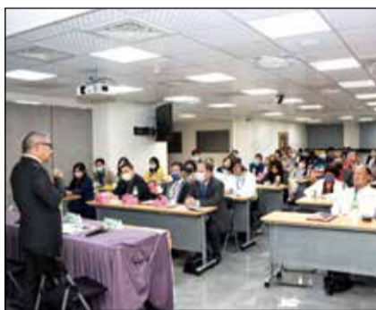
↑會議、戶外活動之構圖完整的照片，可吸引讀者閱讀。