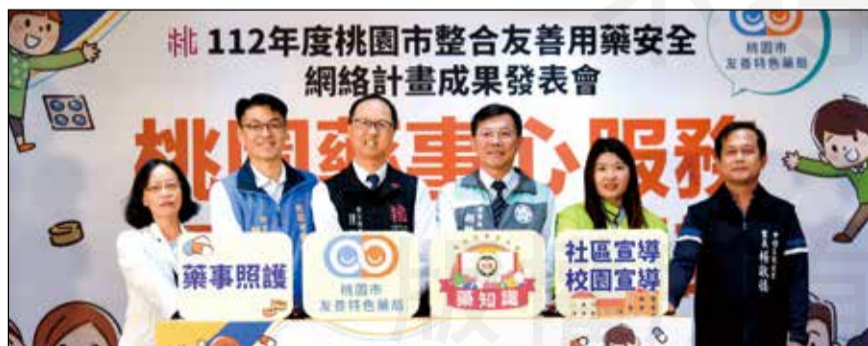
↑桃園市衛生局於11月17日舉行「112年度整合友善用藥安全網絡計畫成果發表記者會」。