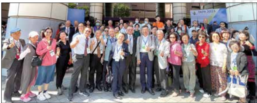
↑高雄市藥師公會有近百名會員特別北上參與FAPA年會開幕。

的相關經驗，能夠在國內參與國際藥學盛會，並在開幕式時與巴基斯坦代表一同進場，真的是很難忘的經驗，深深以身為藥師為榮。