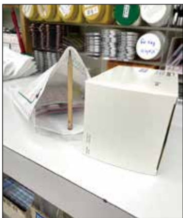
↑包裝大到裝不進藥袋