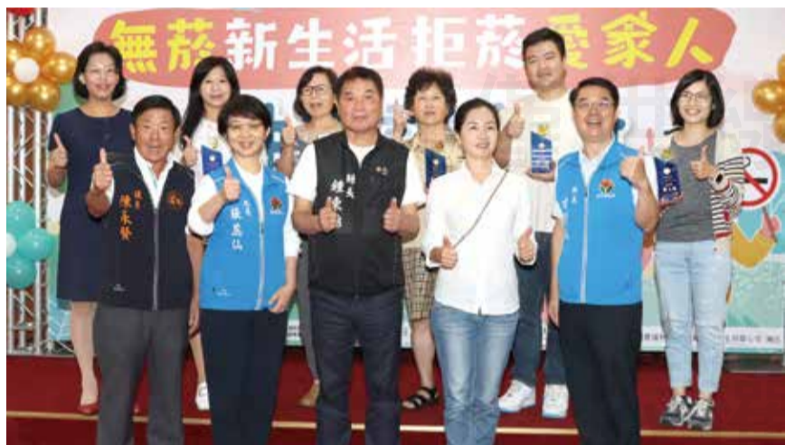
↑苗栗縣衛生局於11月9日舉辦「戒菸，向菸說不」競賽表揚和抽獎活動，苗栗縣長鍾東錦蒞臨頒獎（前排中）。

目前尚未取得戒菸衛教師資格的藥師，只要前往醫事人員戒菸服務訓練系統，線上完成三小時的基礎課程，再加上七小時的專門課程，就可取得戒菸服務人員資格證明，加入戒菸藥局的行列，幫助癮君子擺脫菸品之束縛。