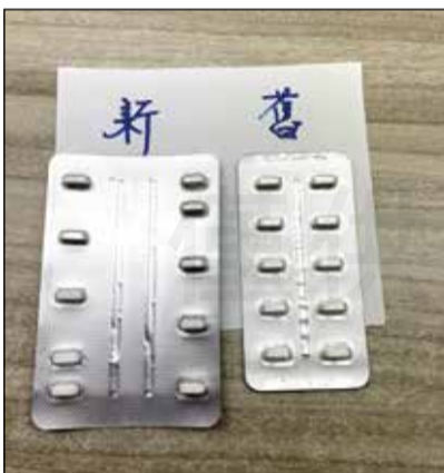
↑新包裝越來越寬 越來越厚