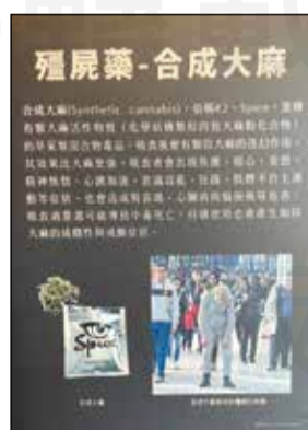
↑國立自然科學博物館近期推出一場別開生面的特展《切中藥害—反毒超有梗》，展期至明(113)年3月3日。