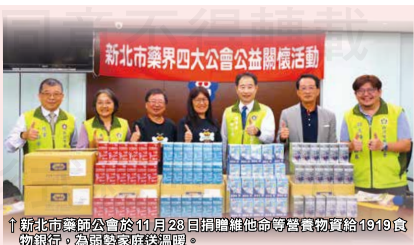
↑新北市藥師公會於11月28日捐贈維他命等營養物資給1919食物銀行，為弱勢家庭送溫暖。