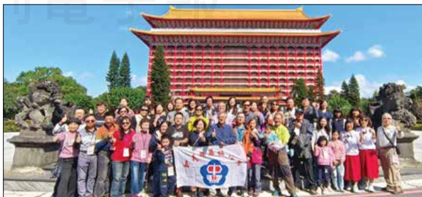
↑嘉義縣藥師公會於11月18、19日舉辦年度自強活動二日遊。

輝表示，此次自強活動，感受台北101高科技建設—高速電梯37秒抵達的快感，及觀賞利用球的物理擺動來減緩101晃動幅度的「風阻尼器」，也體驗探索東密道文化之旅，感謝會員與家屬的踴躍參與，預計於明年(113)年5月會舉辦自強活動1日遊，10月舉辦自強活動二日遊，歡迎大家熱烈參與並繼續支持公會舉辦的活動。