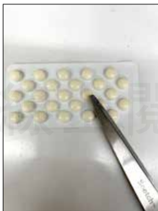
↑有些包裝窄到無處下剪