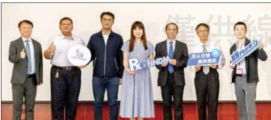
↑第三屆「頂尖控糖藥師高峰會」，11月11日於台中盛大舉行。