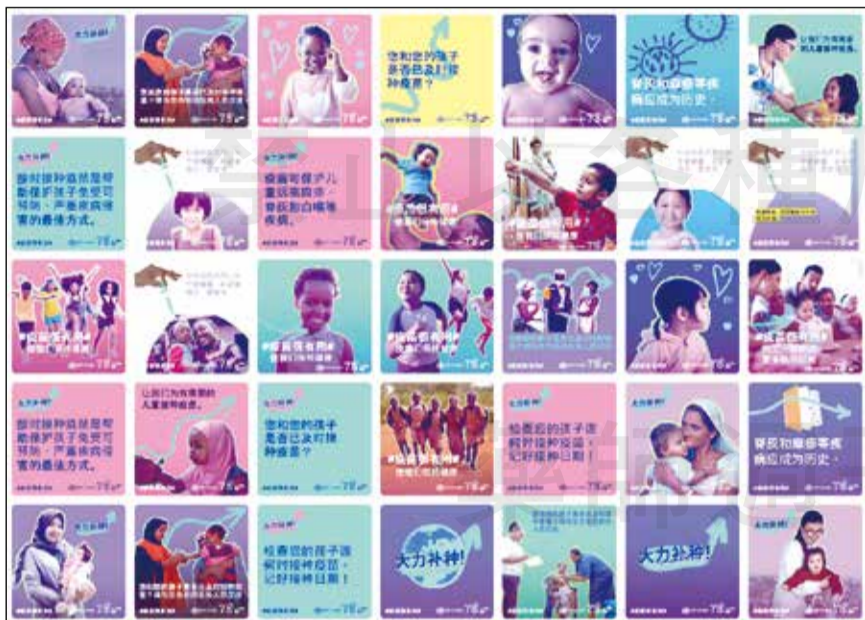
↑ WHO 舉行「2023年世界免疫週」活動，宣傳品提供簡體中文等六種語言版本。