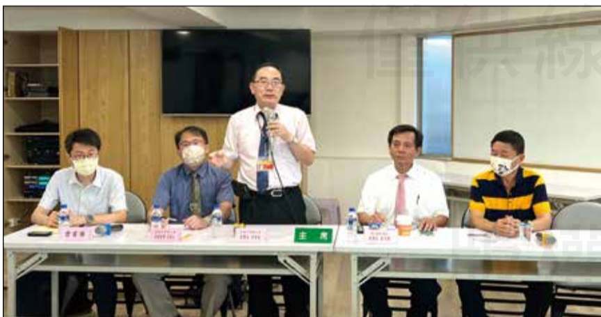
↑針對藥品公司惡性倒閉事件，高雄市第一藥師公會於5月23日召開受害藥局法律諮詢會議。