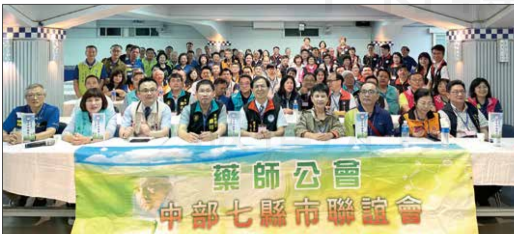
↑由台中市藥師公會主辦的中部七縣市幹部聯誼會，於5月20日在谷關舉行。