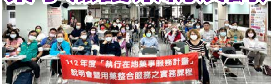
↑高雄市藥師公會舉辦「112年度用藥整合服務之實務課程」。