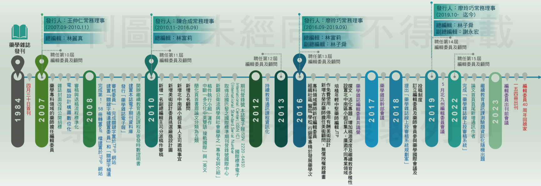
↑ 40年藥學雜誌史實序列 (圖一)