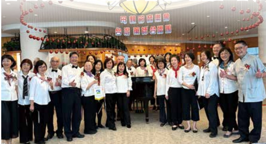
↑ 台灣藥師合唱團用歌聲歡慶母親節。