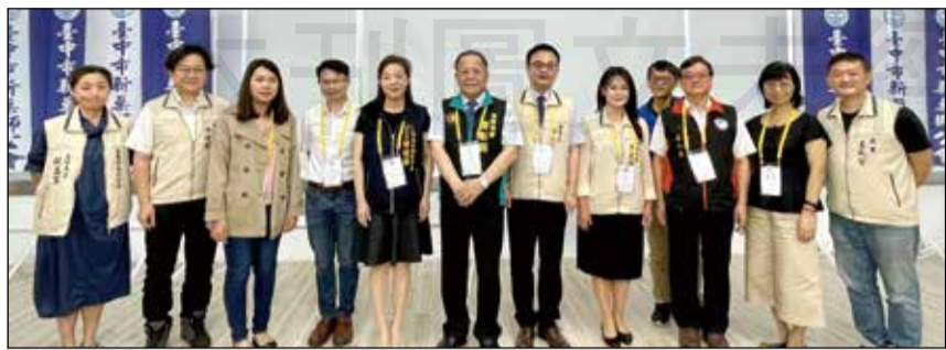
↑藥師公會全聯會偕同臺中市食品藥物安全處與臺中市新藥師公會舉辦「執行在地藥事服務計畫」招募說明會。