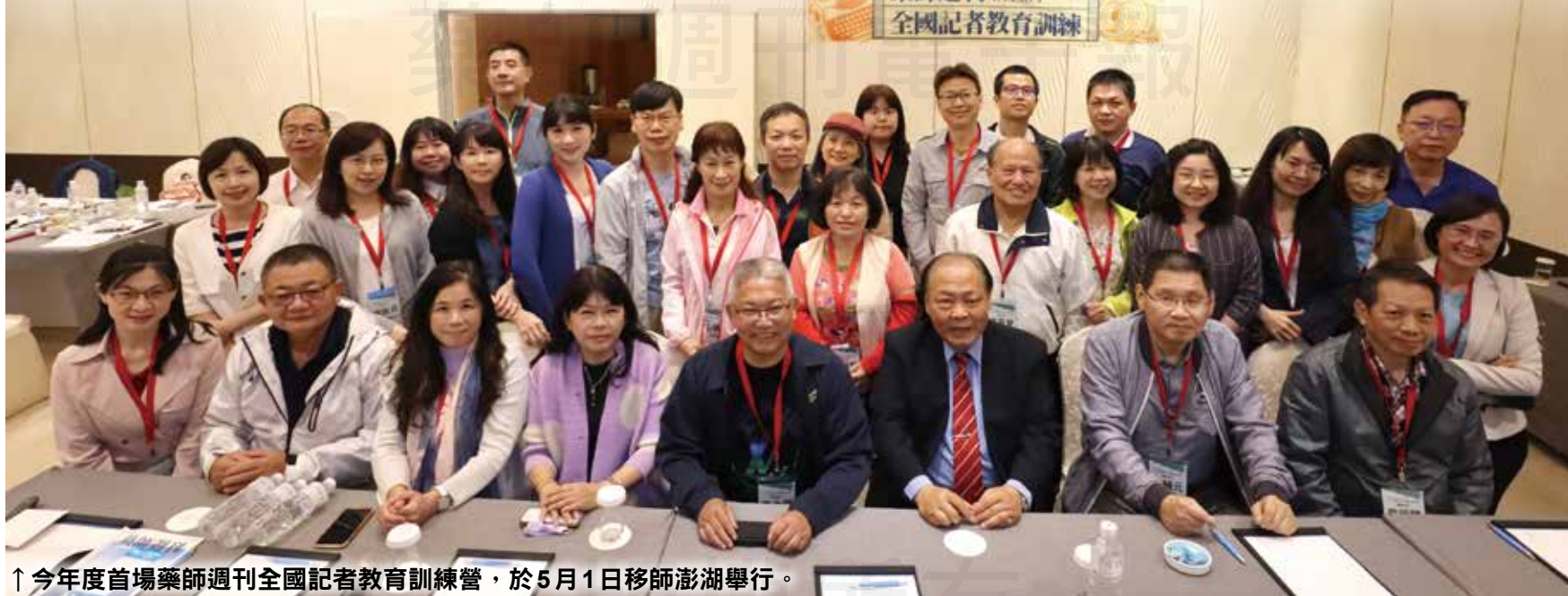
↑今年度首場藥師週刊全國記者教育訓練營，於5月1日移師澎湖舉行。