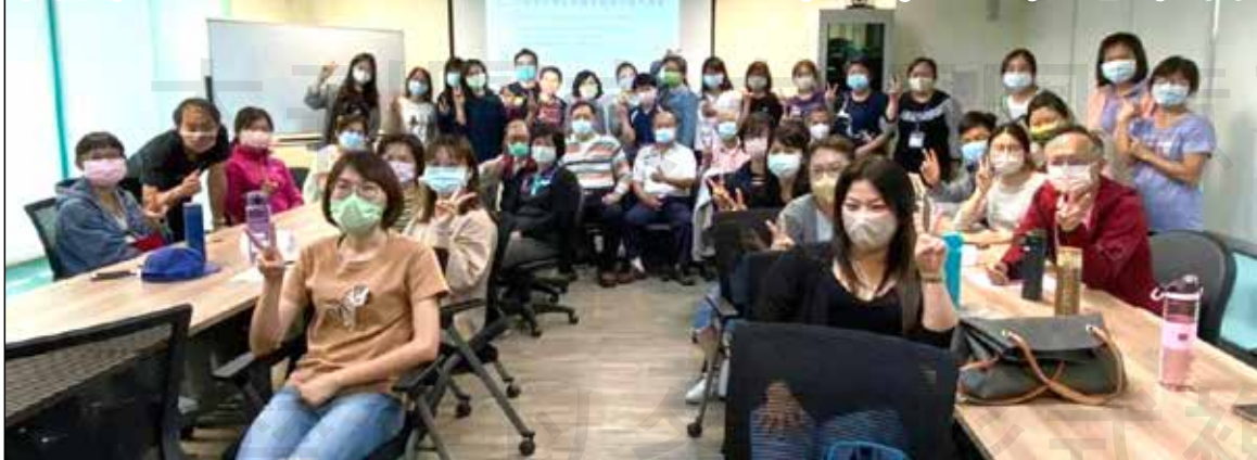
↑彰化縣衛生局於3月25日召集衛生所護理師與共照網藥師齊聚一堂，凝聚對照護的共識。