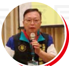
澎湖縣理事長陳福龍