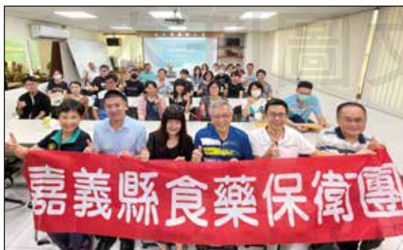
↑嘉義縣藥師公會舉辦「正確用藥教育暨藥事照護種子師資培訓課程」。