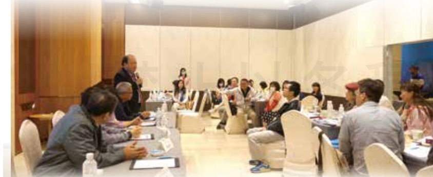
↑澎湖縣長陳光復蒞臨致歡迎詞，他表示，難得有全國性的醫藥團體來到澎湖，除了歡迎更由衷感謝。

充實的課程，不但能了解到離島與本島的醫療資源落差與改善對策，也可藉由實體分組討論，大家互相腦力激盪，發揮學習的成效，之後就能應用在採訪寫作工作上，提供讀者更吸睛的新聞內容。