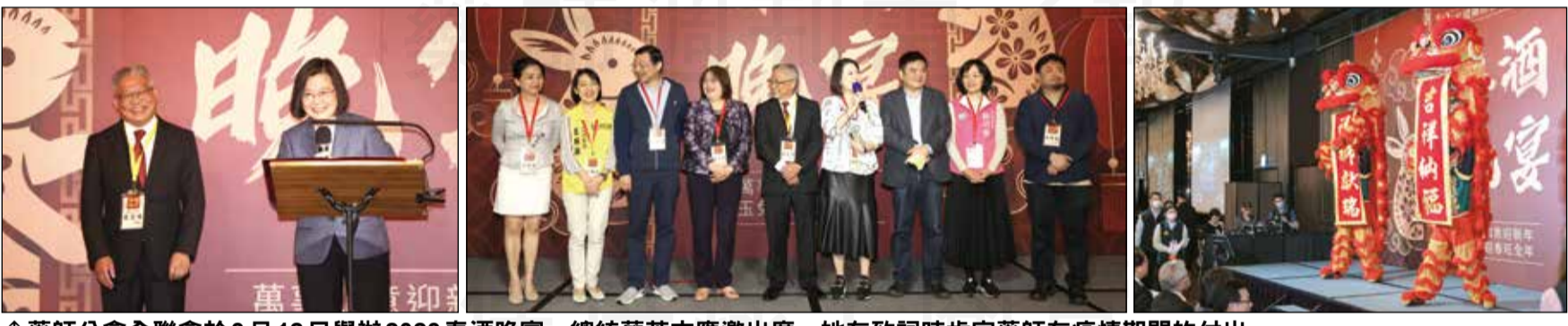
↑藥師公會全聯會於3月12日舉辦2023春酒晚宴，總統蔡英文應邀出席，她在致詞時肯定藥師在疫情期間的付出。

【本刊訊】藥師公會全聯會於3月12日舉辦2023春酒晚宴，總統蔡英文、行政院副院長鄭文燦、衛福部長薛瑞元和內政部長林右昌等貴賓應邀出席。