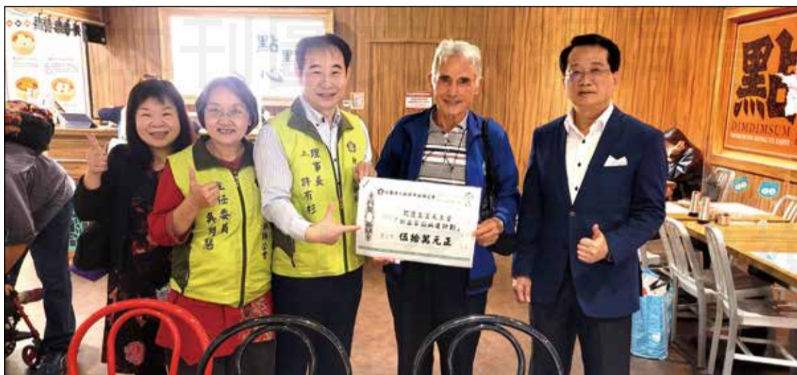
↑ 新北市藥師公會於2月13日捐款給花蓮玉里天主堂，協助「日出家園興建計畫」。