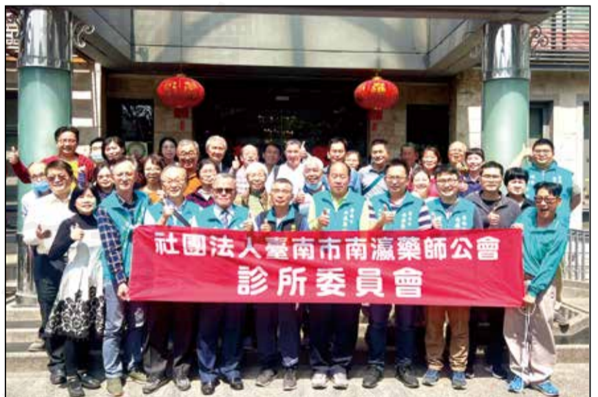
↑台南市南瀛藥師公會於3月5日舉辦診所藥師聯誼會。