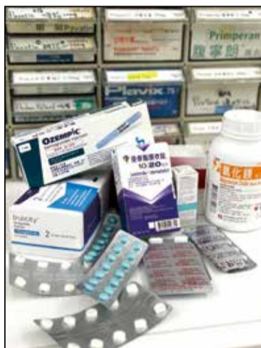
↑今年年初發生大缺藥潮。