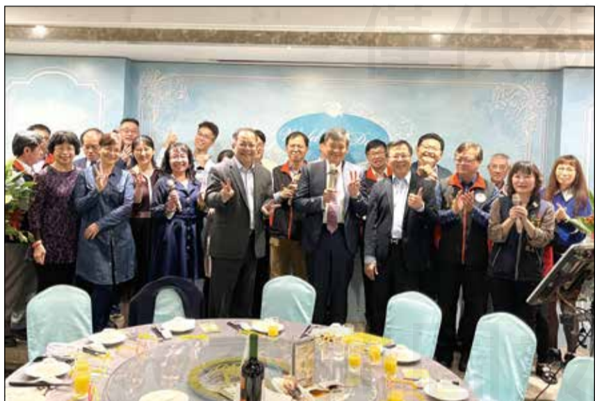
↑台中市藥師公會於2月19日舉辦112年度幹部春酒聯歡晚會。