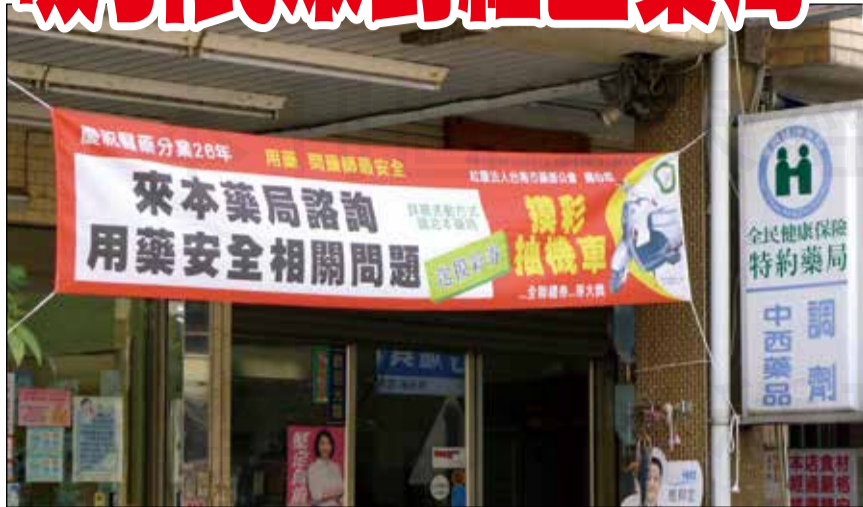
↑台南市藥師公會舉辦民眾到社區藥局諮詢用藥安全相關問題就可參加摸彩送機車的活動，導引民眾到藥局，讓藥師的專業被看見。