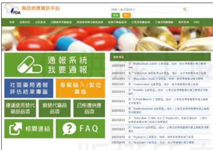
↑衛福部食藥署藥品供應資訊平台。