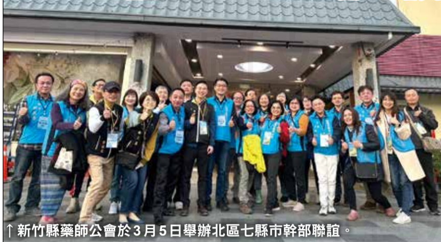
↑新竹縣藥師公會於3月5日舉辦北區七縣市幹部聯誼。