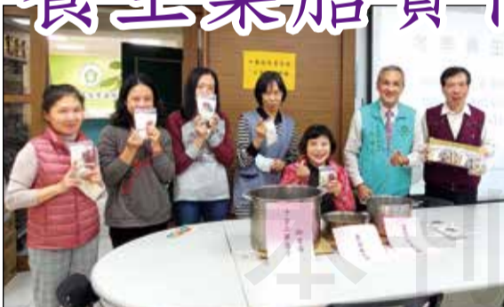
↑嘉義市藥師公會於111年12月21日舉辦冬季養生藥膳實作課程。