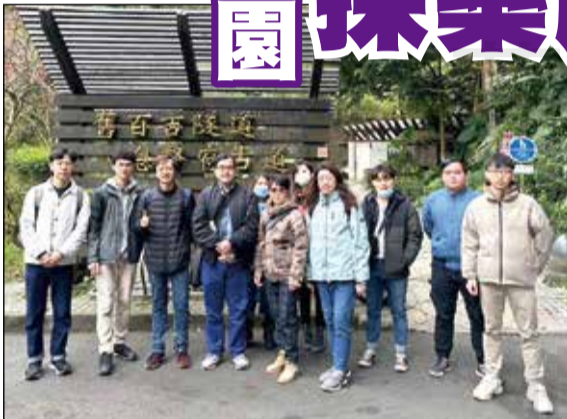
↑桃園市藥師公會於2月4日辦理採藥活動。