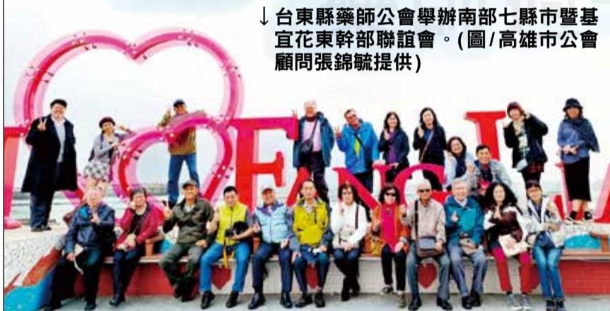
↓台東縣藥師公會舉辦南部七縣市暨基宜花東幹部聯誼會。