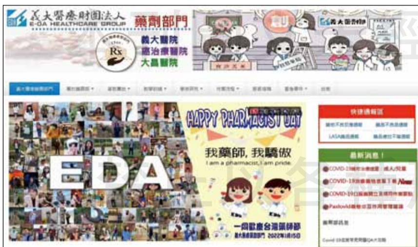
↑醫院藥劑部特別開創新冠專區，讓醫療人員可隨時查詢相關訊息。