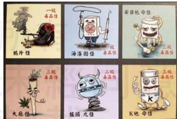
←臺中國立自然科學博物館推出「藥魔鬼怪速速退散-民俗反毒特展」，即日起至明年2月28日於科博館人類文化廳2樓迴廊展區展出。