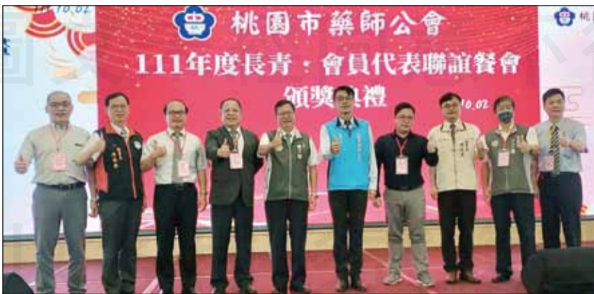
↑桃園市長鄭文燦(左五)出席長青藥師聯誼餐會頒獎典禮，感謝藥師的付出。

桃園市長鄭文燦，率行政團隊出席長青藥師聯誼餐會。頒發整合型用藥安全網絡計畫傑出貢獻獎，及進入桃園市藥師公會達50年、40年、30年資深藥師、績優藥師、子女獎學金等獎項，並