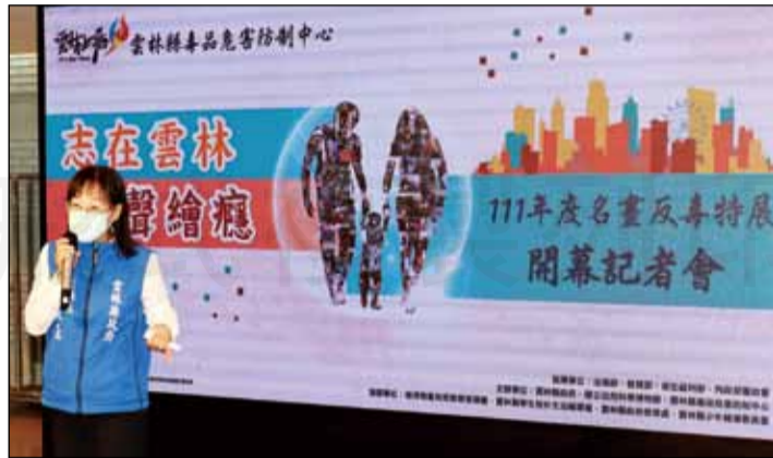
←雲林縣衛生局毒品危害防制中心於10月1日舉行「志在雲林繪聲繪癮」名畫反毒特展開幕記者會。