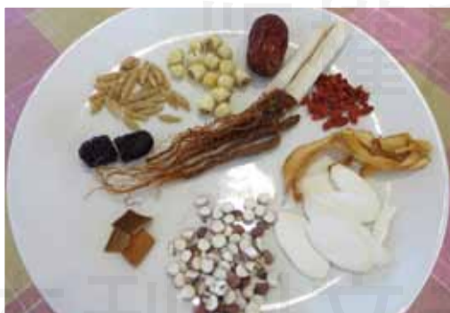
↑相片藥材依序名稱：麥冬、蓮子、紅棗、茯苓、枸杞、玉竹、淮山、芡實、肉桂、黑棗、人參鬚（順序依上到下、左至右）。

若是參考固有成方的藥材選擇，請記得：品名千萬不能用固有成方的方劑名，例如，你千萬不能寫「生脈飲茶包」，這樣是違規，要被罰錢的。