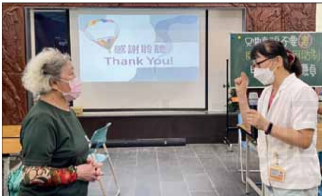
←台東縣衛生局舉辦反毒宣導及藥物濫用防制講座，民眾積極參與並詢問藥師用藥問題。