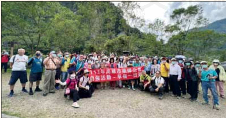
↑ 高雄市藥師公會一年一度自強活動，於8月28日及9月4日分兩梯次舉行。