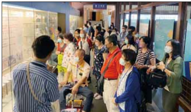
↑臺中市藥師公會產銷學政委員會精心策畫藥廠參訪行程。