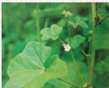
↑圖1 冬葵子原植物形態

苘麻子： 為錦葵科 (Malvaceae) 植物苘麻 Abutilon theophrasti Medic. 之乾燥成熟種子。原植物形態為一年生草本，高1-2m，莖有柔毛，葉互生，圓心形，長5-10cm，葉柄長3-12cm。花單生葉腋，花梗長1-3cm，近端處有節，花萼杯狀，5裂；花黃色，花瓣倒卵形，長1cm；心皮14-20，排列成輪狀。蒴果半球形，直徑2cm，分果瓣14-20，有粗毛，頂端有2長芒。種子黑色，三角狀扁腎形。花期7-8月。生於路旁、田野、山坡或栽培。