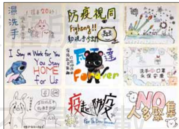
↑自繪手作防疫標語。

體系藥劑部為緩解藥師們內心緊繃的情緒，提出一系列「COVID-19防疫復原力計畫」，藉由各單位發揮創意，表達對同事的關懷與正向鼓