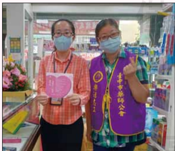
↑台中市藥師公會委由樂活藥師志工隊安排調度志工協助藥局包裝、發放口罩等，與藥師攜手防疫。