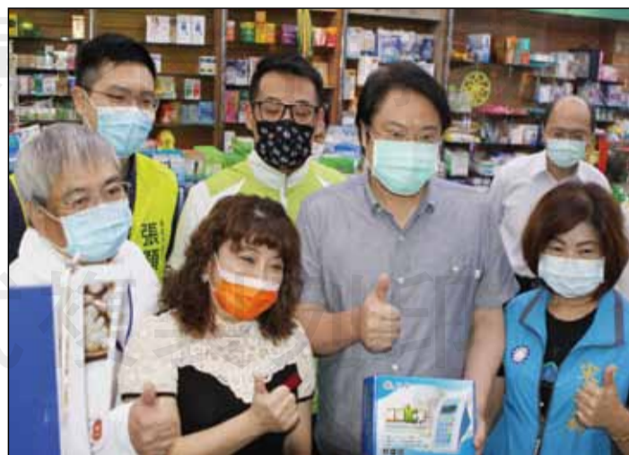
↑基隆市政府即日起補助社區藥局2000元購買防疫物資至5月22日止。

5月6日，林右昌親至基隆市中正區的社區藥局慰問藥師這兩個月的辛勞，並在第一時間發布這個好消息：即日起至5月22日止，於防疫期間曾購入用於防疫的物資，合於法規內即可適用相關補助，上限2000元。詳情可洽基隆市藥師公會。