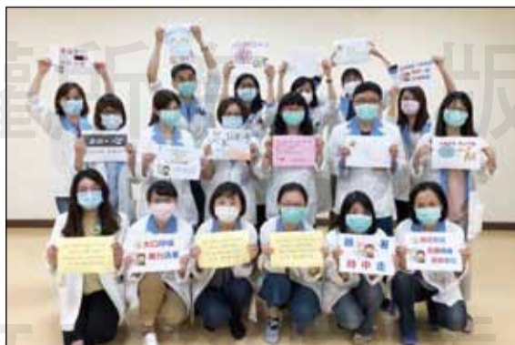
↑義大醫療體系藥劑部為緩解藥師們內心緊繃的情緒，提出一系列「COVID-19防疫復原力計畫」。

體系藥劑部為緩解藥師們內心緊繃的情緒，提出一系列「COVID-19防疫復原力計畫」，藉由各單位發揮創意，表達對同事的關懷與正向鼓