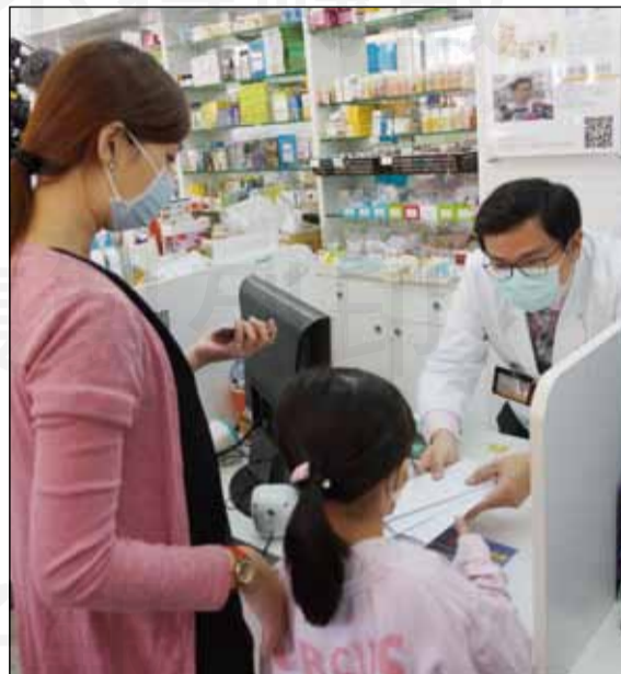
↑感謝社區藥局藥師協助防疫代售口罩，完整展現公衛的功能，落實社區照護。

每天看著社區藥師的分享，可以感受到代售口罩這件事情真的不簡單，想說聲謝謝您們。社區藥師完整展現了公衛的功能，落實社區照護，這點真的令人佩服，這段紀錄一定會