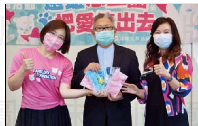
←遠雄文教公益基金會感謝藥師協助實名制口罩販售的辛勞，於5月8日贈1400個口罩套給藥師公會全聯會。

遠雄文教公益基金會指出，全國六千多家健保特約藥局全力配合新冠肺炎防疫政策，藥師親上第一線與民眾接觸，協助實名制口罩的販售。除此之外，為避免醫院內群聚感染，許多民眾也