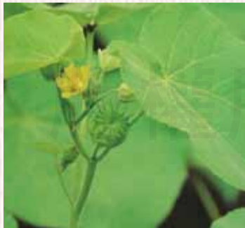
↑圖2 苘麻子原植物形態 (圖1、2取自財團法人必安研究所 https://reurl.cc/d0yE0z )