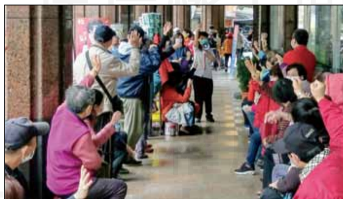
←藥師發放口罩，面對排隊民眾能做些什麼？筆者拿著大聲公說明發放規則及如何正確配戴口罩，展現專業。

罩？如何正確配戴口罩？如何脫口罩？接下來，分析市面上各種消毒水使用時機與優缺點、酒精最適當的消毒濃度及如何將95%的酒精稀釋成75%酒精並回答民