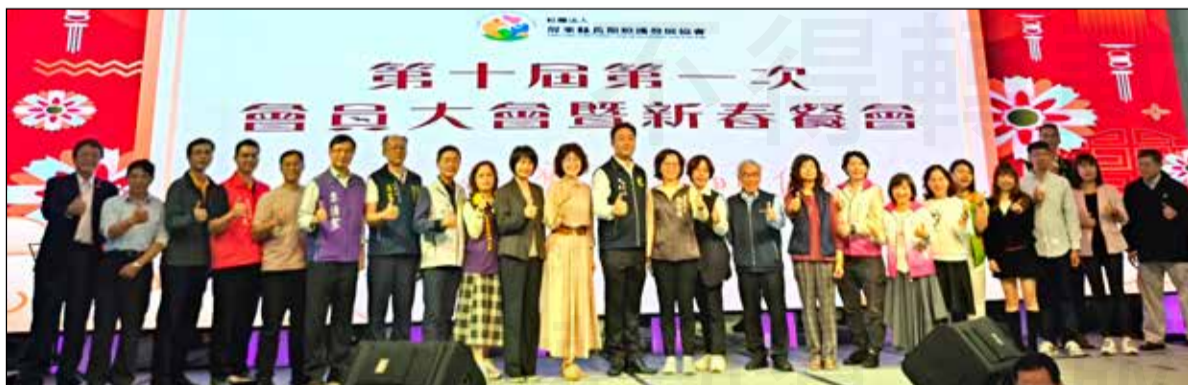
↑屏東縣藥師公會受邀參與「屏東縣長期照護發展協會」會員大會。