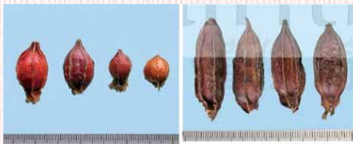
圖一、梔子果實之外觀性狀 圖二、水梔子果實之外觀性狀 圖片4來源：Yung-Chuan Hsieh et.al, Studies on Adulteration and Misusage of Gardeniae Fructus in Market, 2011.

圖片3來源：Yung-Chuan Hsieh et.al, Studies on Adulteration and Misusage of Gardeniae Fructus in Market, 2011.