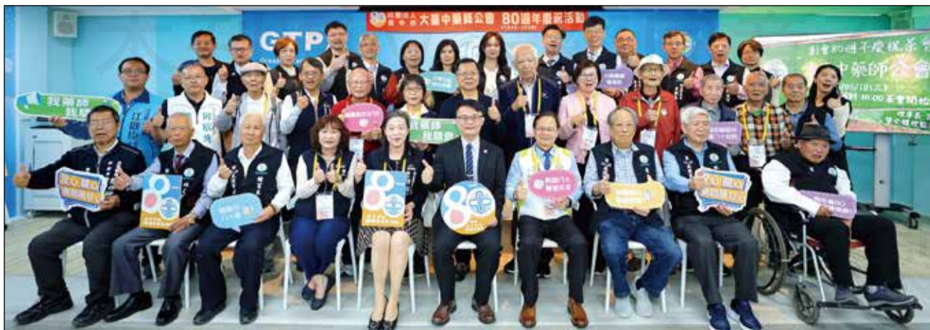
↑大臺中市藥師公會歡慶創會80週年紀念日，邀請80歲以上資深藥師及歷任理事長齊聚會館。