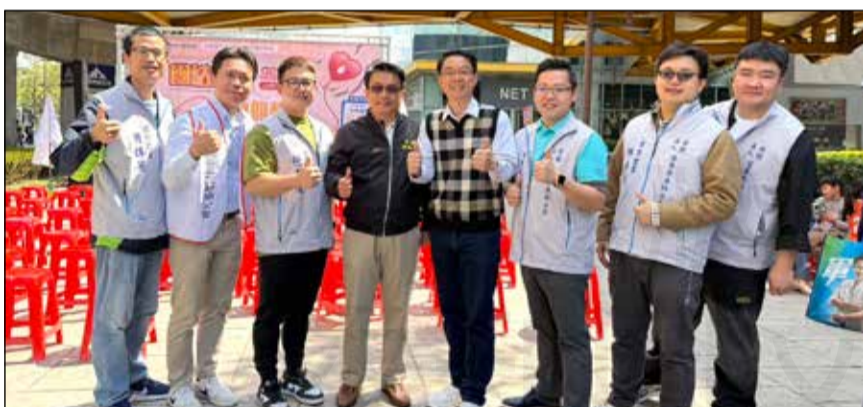
↑苗栗縣藥師公會與苗栗分區扶輪社攜手合作，舉辦捐血活動，號召民眾挽袖來行善。