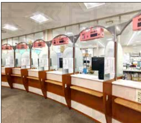
↑嘉南藥理大學藥學系團隊遠赴東京八王子藥劑中心藥局進行為期五週的深度實習。