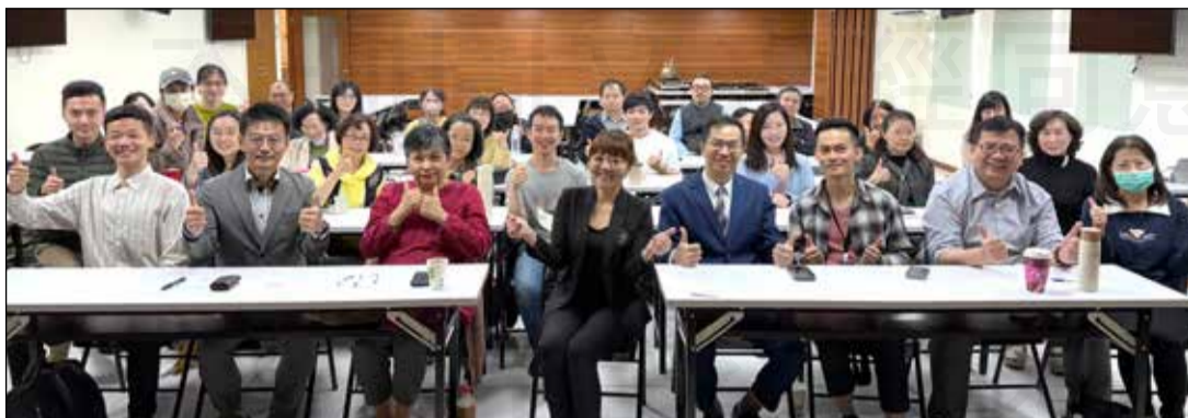
↑台北市藥師公會舉辦「如何處理公關危機」系列課程。