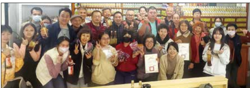
↑中藥實務班分享痛風的療養「常用方劑、泡腳包暨藥酒浸泡實作」。