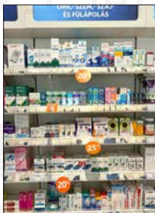
↑匈牙利藥局內部製劑調配工作與藥品展示櫃。