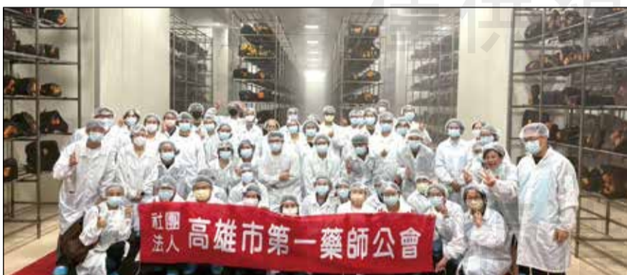
↑ 高雄市第一藥師公會舉辦產學交流活動。