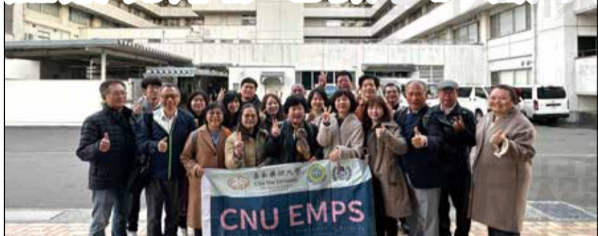
↑東北醫科藥科大學附設醫院前合影。