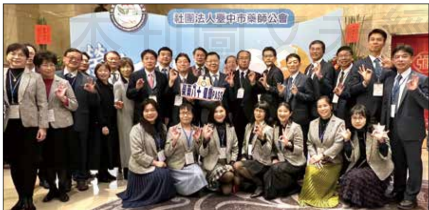
↑臺中市藥師公會幹部與日本貴賓合影。