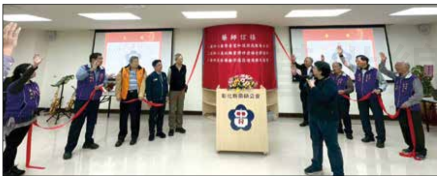
↑彰化縣藥師公會南郭會館落成揭牌啟用。