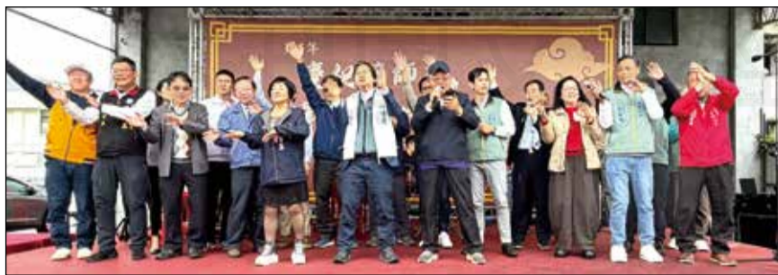
↑花蓮縣藥師公會辦理「慶祝藥師節 歡喜呷辦桌」餐會活動。

◎文／花蓮縣記者趙瑞平 為慶祝一年一度的藥師節，花蓮縣藥師公會於1月25日辦理「慶祝藥師節 歡喜呷辦桌」餐會活動，邀請藥師會員齊聚一堂，在溫馨熱鬧的氛圍中，共同交流情誼，感謝彼此長期於專業崗位上的付出與努力。此次活動結合傳統辦桌文化、在地音樂演出及食農教育體驗，內容豐富多元。餐會現場邀請在地團體「洄響樂坊」帶來精