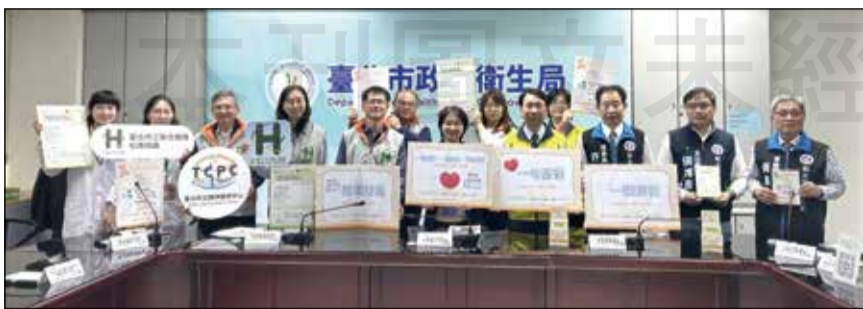
↑ 臺北市藥師公會攜手臺北市立聯合醫院松德院區與新北市藥師公會，共同啟動「醫藥合作自殺防治網」。