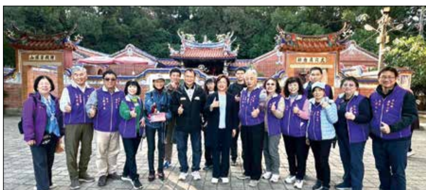
↑歡慶藥師節，彰化藥師公會舉辦健行活動。

◎文／彰化縣記者劉鈴惠 專屬我們的節日藥師節又來臨，公會為了連絡會員情誼，在考量老少兼顧的思維下，選擇位於花壇的彰化名勝古蹟-虎山巖作為這次健行的地點。有人常說彰化既無高山也無著名的風景點，但如靜下心來欣賞，就會發現彰化是個人文薈萃的地方。從以前膾炙人口的「一府二鹿三艋舺」，鹿港即是和台南並列的文化古城。而這次選定的虎山巖，也是彰邑三大名巖中碧山巖、清水巖和虎山巖之一，都屬於三級古蹟。近年經縣府努力規畫，除後山一大片金針花海聞名