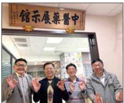
↑臺中市藥師公會適逢成立八十周年之際，特別於元月在會館內正式設立「中醫藥展示館」。