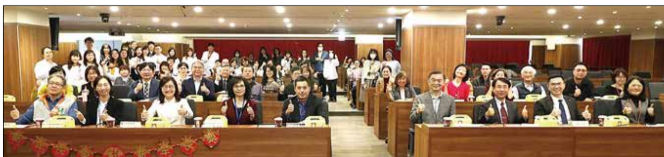
↑臺北市立聯合醫院藥劑部舉辦「115年藥師節優良藥師暨資深藥師表揚大會」。