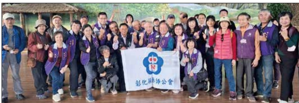
↑彰化縣藥師公會安排異業取經之旅。