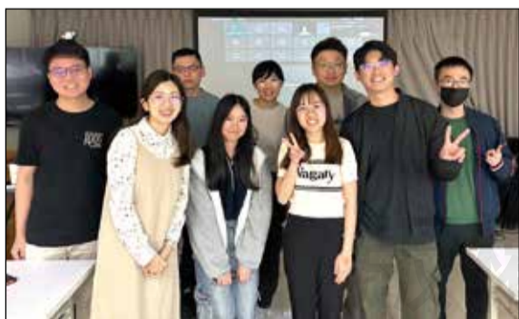
↑年輕藥師協會舉辦為期兩天的「社區藥局藥師培訓講座」。