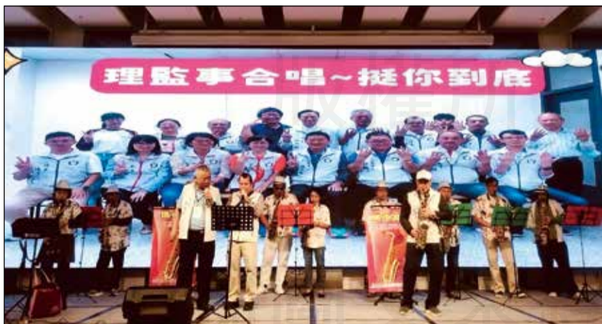
↑屏東縣藥師公會於一月舉行會員大會。