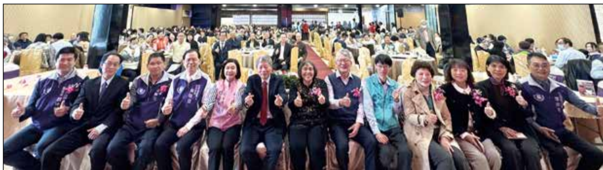
↑雲林縣藥師公會召開會員代表大會（右圖中為雲林縣長張麗善）。