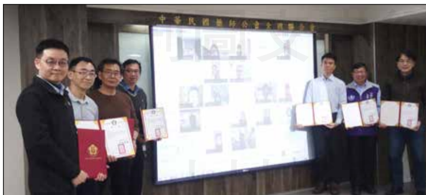
↑全聯會中藥發展委員會於1月21日舉行第16屆第一次委員會議。