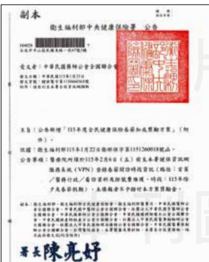
↑健保署公告「115年度全民健康保險春節加成獎勵方案」。

【本刊訊】隨著農曆春節即將來臨，連假期間天氣變化大、聚餐頻繁，感冒、腸胃不適及慢性病藥品不足等情形常見，社區藥局第一線也經常接到民眾詢問：「春節那幾天哪裡還有藥局開？」藥師公會全聯會指出，「找得到藥局、找得到藥師」是春節用藥安全的重要關鍵，社區藥局在春節期間所扮演的角色更顯重要。