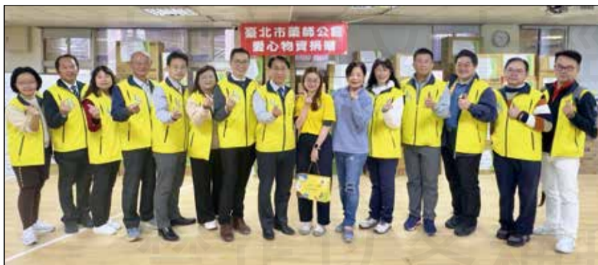
↑臺北市藥師公會捐贈物資給台北市三玉啟能中心。