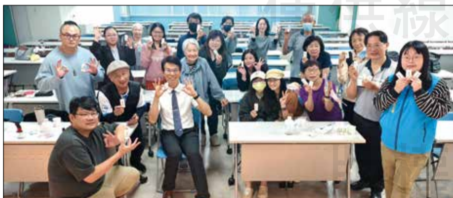
↑臺中市藥師公會舉辦「認知關懷長者皮膚乾癢照護之整合應用一膏劑與芳療實務探討」課程。