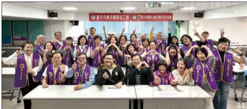
↑臺中市樂活志工隊舉辦志工成長課程。