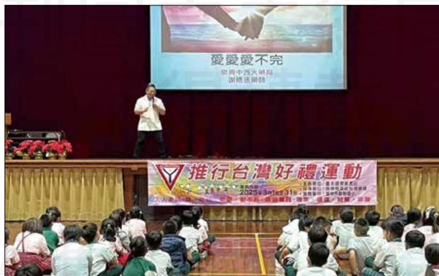
↑藥師參與用藥安全衛教講座。

回首每場演講皆是殫精竭慮，不敢有半點懈怠。始終懷著一顆感恩之心，感念各單位對筆者的青睞有加；秉持一顆積極之心，在衛教的田野上辛勤耕耘。更重要的是，守著那一顆不忘初衷的心，將每場講台都視為初次