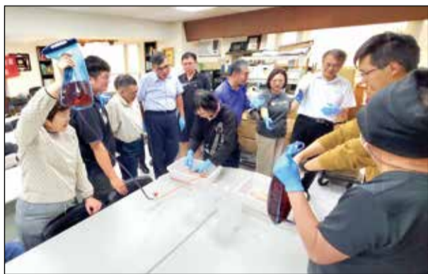
↑嘉義市藥師公會舉辦「創傷緊急止血」課程。