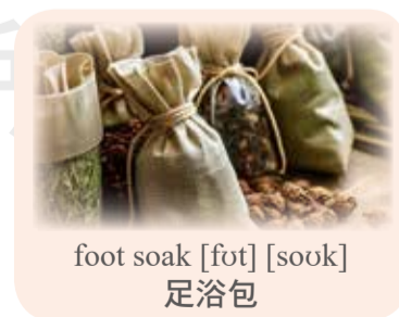
foot soak [fot] [sok] 足浴包

As a cold front approaches, stay warm with Chinese herbal cuisine. Goji berries and red dates provide nourishment and rich flavor. Pair it with a traditional Chinese medicine foot soak to promote circulation and relieve cold hands and feet.