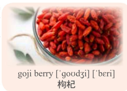
goji berry ['goudzi] ['beri] 枸杞