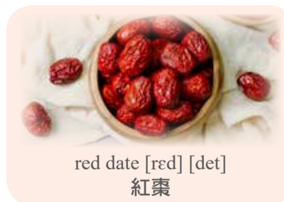
red date [red] [det] 紅棗