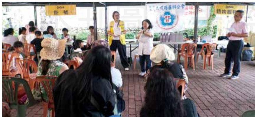
↑南投縣藥師公會參與偏鄉義診活動。