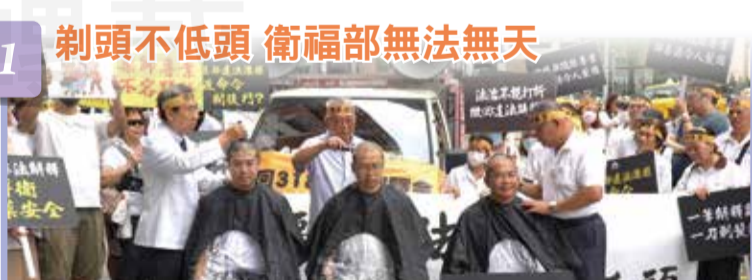
剃頭不低頭 衛福部無法無天