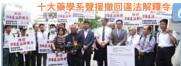
十大藥學系聲援撤回違法解釋令