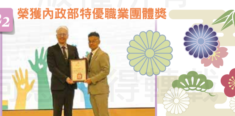
榮獲內政部特優職業團體獎