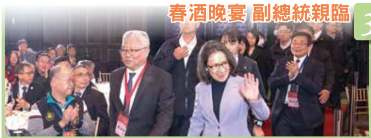
春酒晚宴 副總統親臨