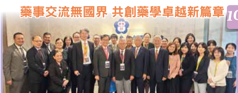
藥事交流無國界 共創藥學卓越新篇章