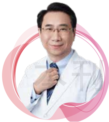
臺北市藥師公會理事長