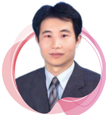
新北市藥師公會理事長