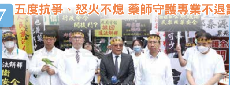
五度抗爭、怒火不熄 藥師守護專業不退讓