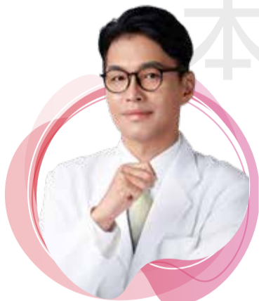
桃園市藥師公會理事長