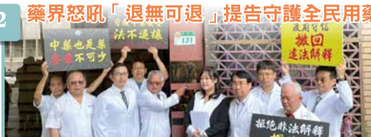
藥界怒吼「退無可退」提告守護全民用藥