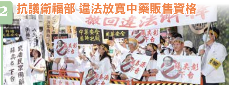
抗議衛福部 違法放寬中藥販售資格