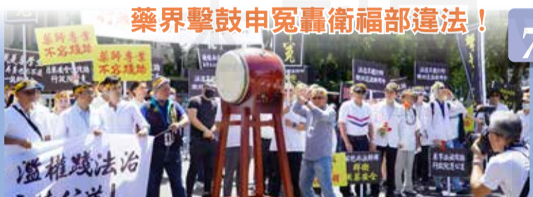
藥界擊鼓申冤轟衛福部違法！