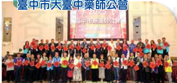
臺中市大臺中藥師公會