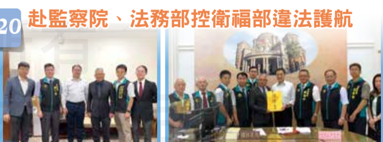
赴監察院、法務部控衛福部違法護航