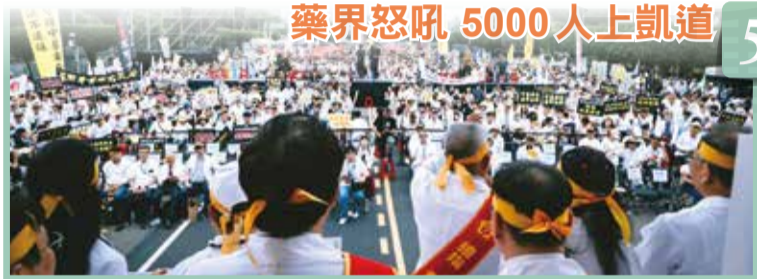
藥界怒吼 5000人上凱道