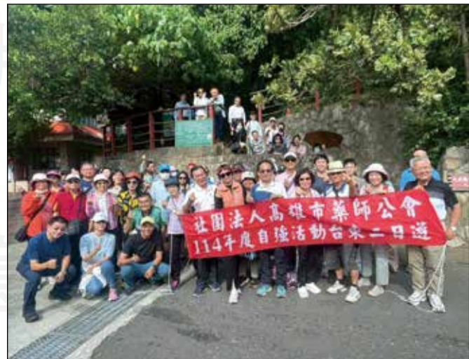
↑ 高雄市藥師公會舉辦「台東知本二日遊」自強活動。