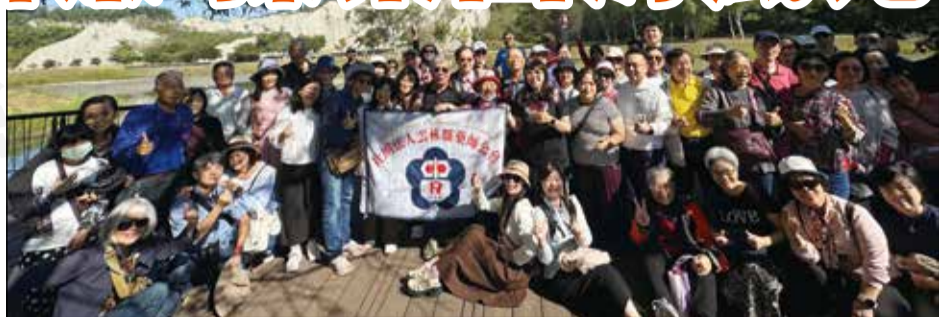
↑ 雲林縣藥師公會舉辦年度自強活動。