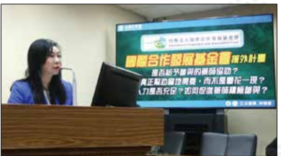
↑立委/理事長林憶君11月20日於外交及國防委員會中，強調海外醫療任務需要完整的醫療團隊，而藥師的專業不該缺席。

【本刊訊】海外醫療任務需要完整的醫療團隊，而藥師的專業不該缺席！立委/全聯會理事長林憶君11月20日於外交及國防委員會中，替藥師發聲，指出目前外交替代役醫療專長資格雖涵蓋「醫學、護理、公共衛生、醫療資訊、營養」，卻獨缺「藥學」。