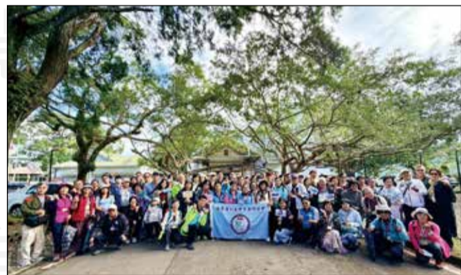
↑ 臺中市藥師公會於10月分梯次舉辦一日遊自強活動。

公會精心籌辦的一日遊活動讓藥師們得以暫時卸下繁忙的工作重擔，從大自然的洗禮與人文歷史的探索中，獲得充分的休憩與能量，期待藥師們能帶著這份心曠神怡，繼續為全民的健康把關。