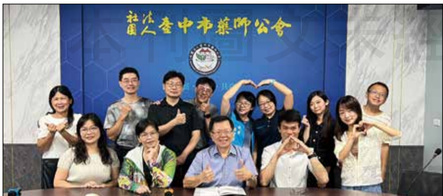
↑臺中市藥師公會明年即將邁入創會80周年，展開系列活動籌劃。