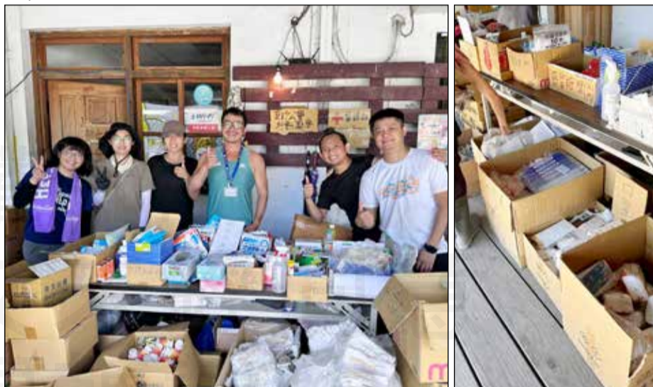
↑ 颱風重創花蓮，藥師團隊趕赴災區，與醫療團隊合作。

「勿恃敵之不來，恃吾有以待之」，面對天災地變，藥師當能盡一己之力，來解決民眾的難題，縱然有所挑戰，我們也能提早商討準備，逐一克服。