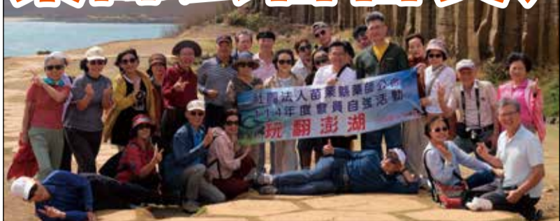
↑ 苗栗縣藥師公會舉辦玩翻澎湖三日遊。