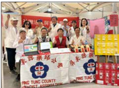
↑屏東縣衛生局於屏東縣立體育館舉辦「屏東健康博覽會」。屏東縣藥師公會以「秋冬藥膳保養、日照有我，藥您安心」為主題設攤。