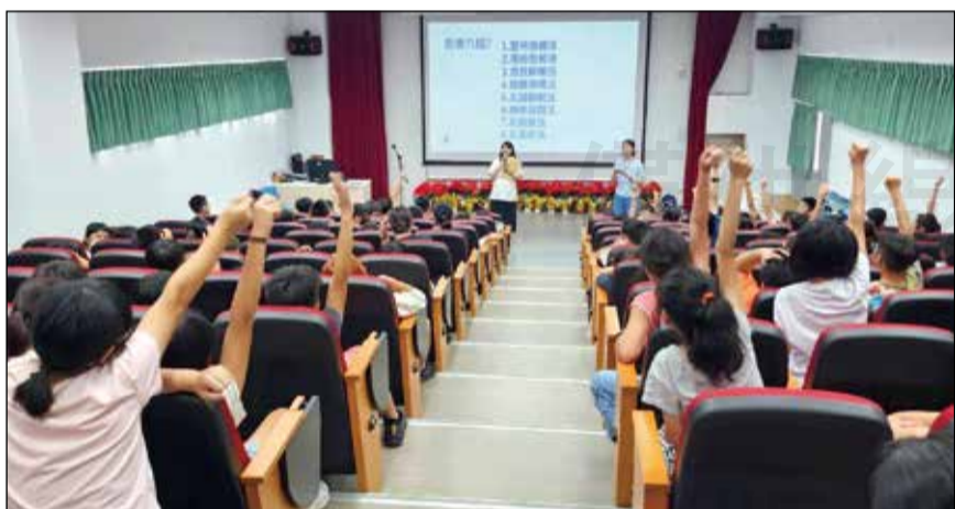
↑年輕藥師走入校園反毒宣導與同學互動零距離。