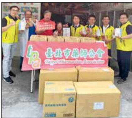
↑臺北市藥師公會團隊捐贈物資愛心送花蓮災區。