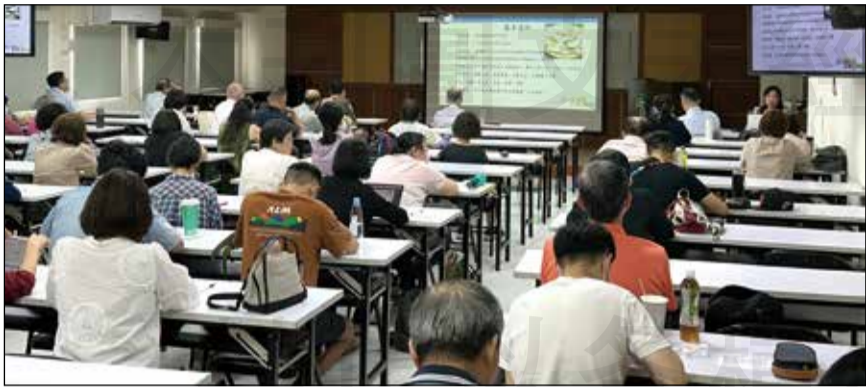
↑臺北市藥師公會中藥發展委員會辦理「中藥藥品安全監測及通報教育訓練」課程。