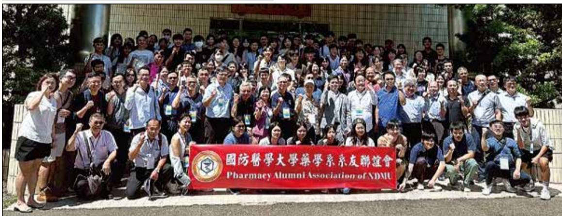
↑國防醫學大學藥學系系友中部聯歡之旅。員榮醫療體系與國防醫學大學藥學院簽署《合作意向書》（上圖）。