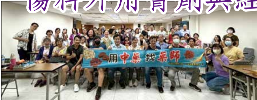
↑桃園市藥師公會邀請重量級講師，說明中傷科用藥及經筋醫學的奧秘。