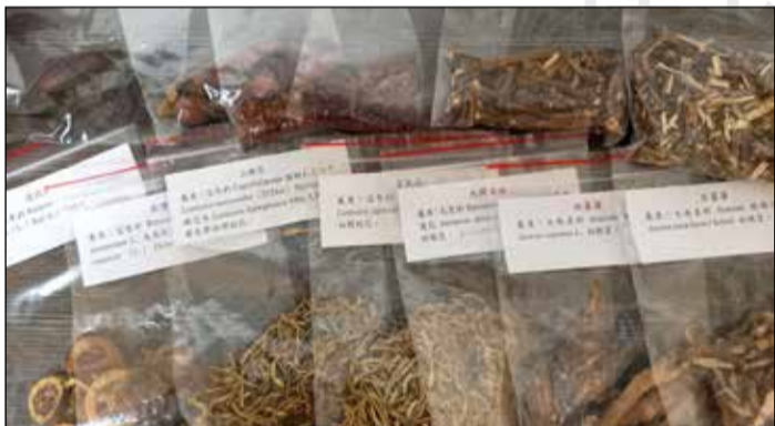
↑正品及其混淆品，幫助明瞭地辨識、比對。