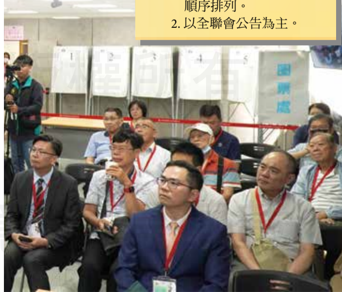
↑藥師公會全聯會於9月29日召開第一次理事、監事會議，並順利完成第16屆常務理事、常務監事、監事會召集人、理事長選舉。