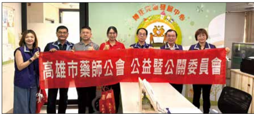
↑高雄市藥師公會於9月18日舉辦「陪遲緩兒玩遊學習一日行」志工活動。