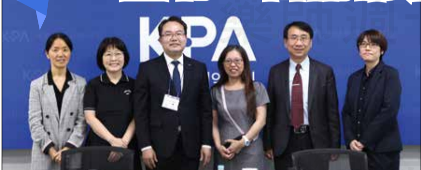
↑臺北市藥師公會參訪首爾市藥師會姐妹會。