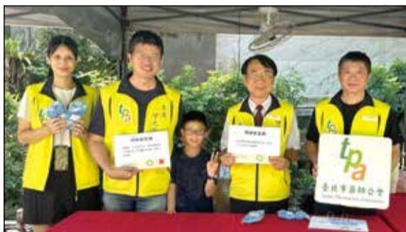
↑台北市藥師公會設立「正確用藥安心站」，提供民眾正確用藥資訊。