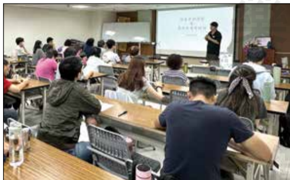
↑ 桃園市藥師公會中藥委員會以「補養方劑演變及單味藥運用概論」為題，分享方藥的特性與使用方向。