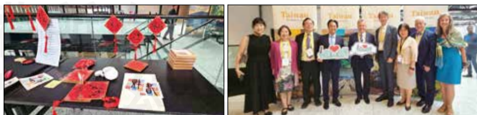
↑ 國際嘉賓體驗台灣書法文化交流。 ↑ 台灣代表團與國際藥學領袖齊聚一堂。