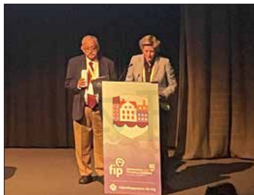
←以「人工智慧作為提升藥物研發成本效益的加速器」為主題的論壇。