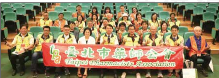
↑臺北市藥師公會安排科達製藥廠交流活動。