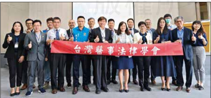
↑台灣醫事法律學會於8月31日，在苗栗縣衛生局舉辦台灣醫法實務論壇。