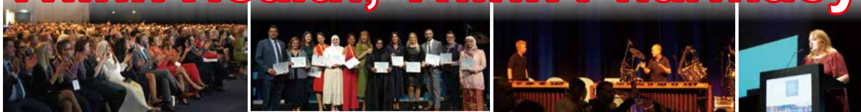
↑ 第83屆FIP年會在丹麥隆重登場。 ↑ 開幕典禮中頒獎表彰卓越成就得獎者。 ↑ 丹麥知名樂團為典禮揭開序幕。 ↑ 丹麥藥學會主席致詞。