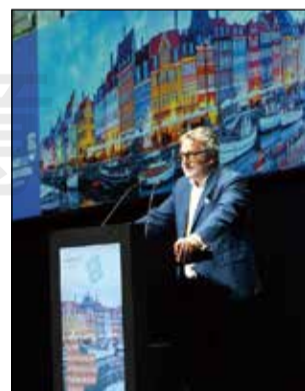
↑「提升銀髮族藥事照護」專題會議。