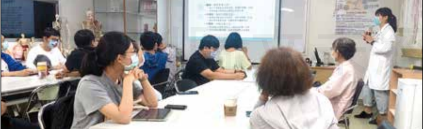
↑全聯會舉辦「114年藥師中藥進階實務訓練課程 中部場」。