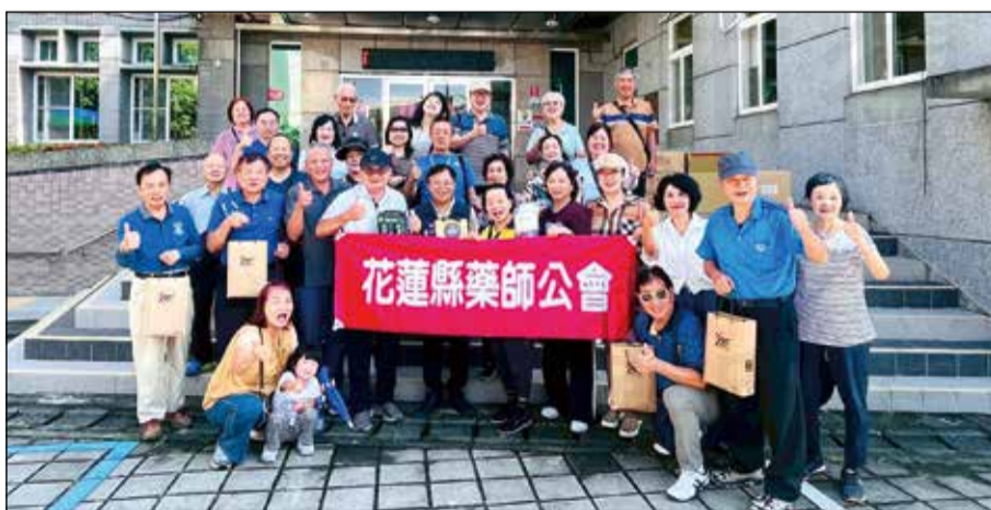
↑花蓮縣藥師公會安排8月24日參訪嘉義縣番路鄉。