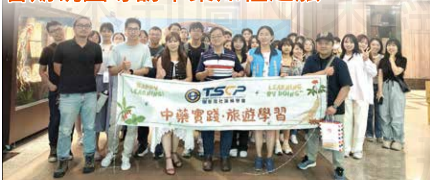
↑臺灣社區藥學會舉辦藥用植物及中藥藥廠之知性參訪之旅。