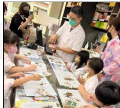
↑藥師在藥局舉辦多場「小小藥師體驗營」，家長和小朋友對藥局同時販售西藥與中藥感到好奇。藥師準備活動小點心-枸杞愛玉凍。