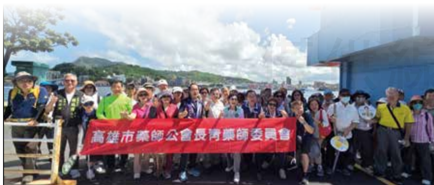
↑高雄市藥師公會舉辦「114年長青藥師旗津燈塔砲台健走」。