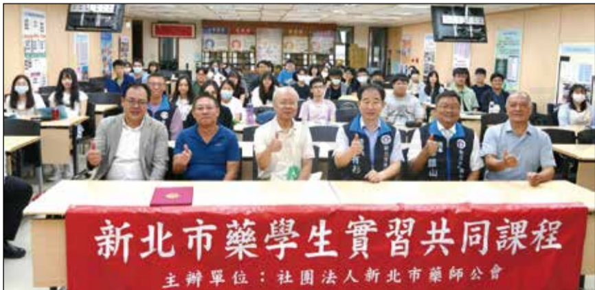
↑新北市藥師公會於8月20日舉辦「藥學生實習共同課程」。