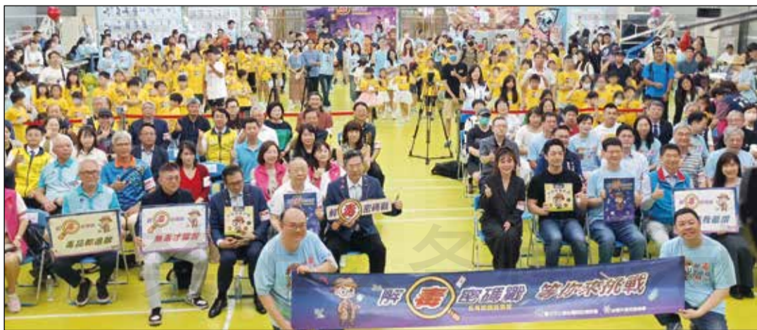
↑臺北市立聯合醫院攜手各公協會團體，共同舉辦「解毒密碼戰」反毒闖關遊戲。