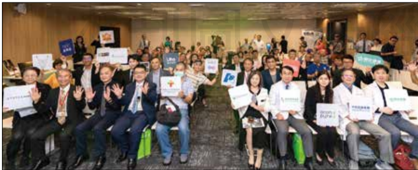
↑全人健康高峰論壇由臺北市藥師公會在內等各公協會合作舉辦。