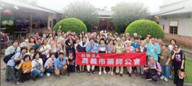
↑嘉義市藥師公會舉辦紫南宮聚財、活盆地划獨木舟驚奇一日遊聯誼活動。