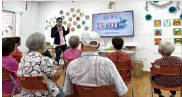
↑由雲林縣西螺衛生所、雲林基督教醫院及雲林縣藥師公會共同於西螺社區舉辦一場糖尿病用藥與健康照護宣導活動。

為提升社區民眾對糖尿病的認識與自我管理，8月7日由雲林縣西螺衛生所、雲林基督教醫院及雲林縣藥師公會共同於西螺社區舉辦一場糖尿病用藥與健康照護宣導活動。活動針對糖尿病成