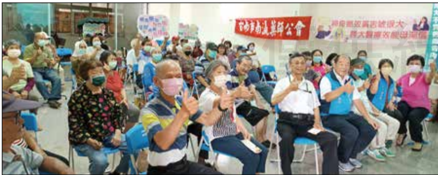
↑台南市南瀛藥師公會展開八場「用藥安全暨辨識違規廣告藥品」巡迴宣導活動。