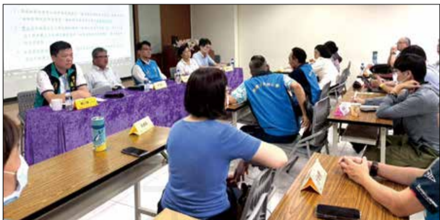
↑桃園市藥師公會於7月18日理監事聯席會議，通過理監事幹部職務異動。