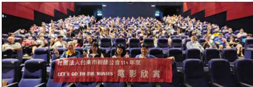
↑台南市藥師公會舉辦電影欣賞活動。