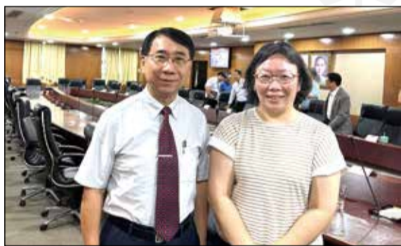
↑交通部召開駕駛人醫學諮詢會會議。