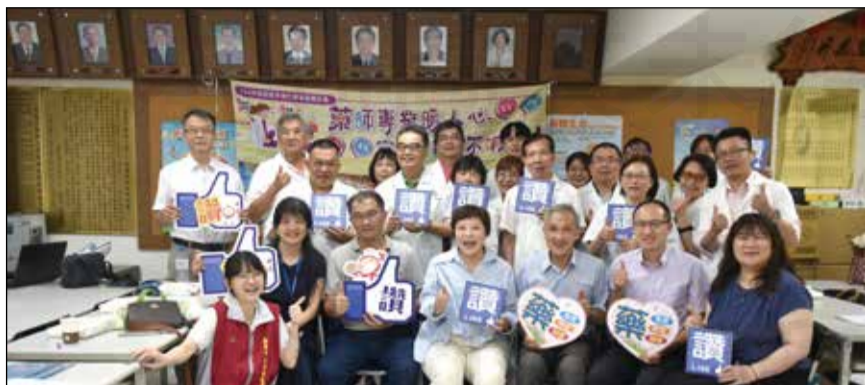
↑嘉義市藥師公會於7月3日舉辦「社區用藥安全宣導種子講師培訓課」。