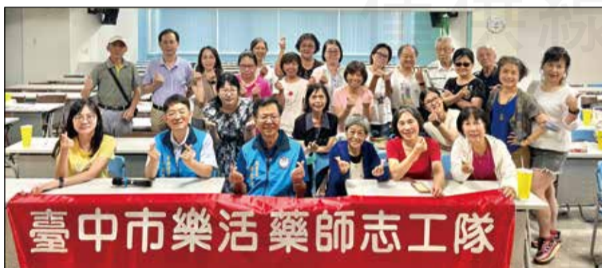
↑臺中市藥師公會樂活藥師志工隊舉辦「114年度樂活藥師志工成長課程」。