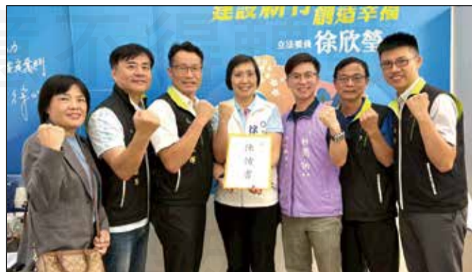
↑全聯會幹部偕同新竹縣藥師公會拜訪立委林思銘(左圖右四)、徐欣瑩(右圖右四)，由橫山鄉鄉長張志弘藥師(左圖左三)陪同，陳情藥事法第103條爭議解釋。