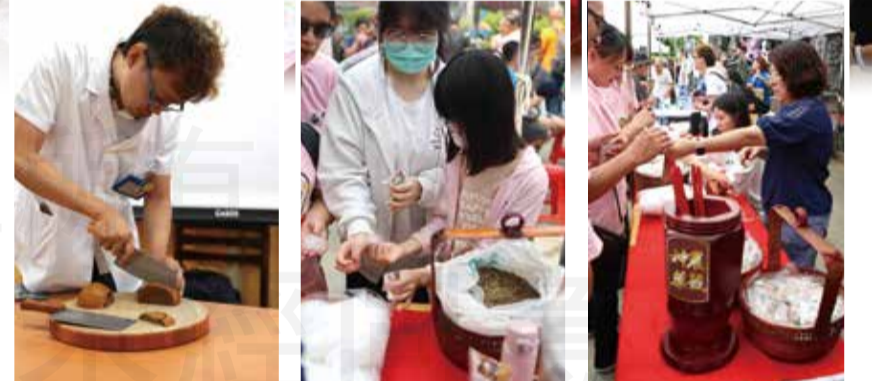
↑活動現場神農藥籤、防蚊包DIY體驗。

實地講授課程，筆者以「三皇」的神農氏為開頭，講解融入在「食(十全)、衣(大青、梔子)、住(艾葉、菖蒲)、行(沒藥、乳香)、育(芍藥、牡丹、茱萸)、樂(楮樹)」的藥材實例，接著帶入社區藥局三寶：「仙楂餅」、「八仙果」、「防蚊包」的銷售及推廣，