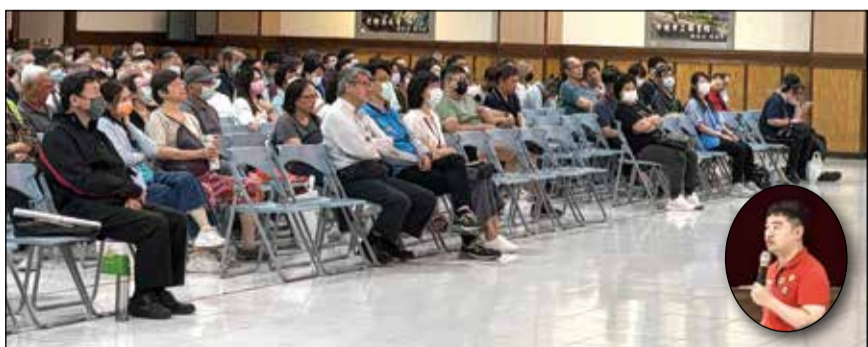
↑桃園市衛生局舉辦社區藥局分區座談會。