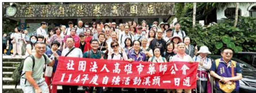
↑高雄市藥師公會舉辦自強活動「溪頭妖怪森林一日遊」。