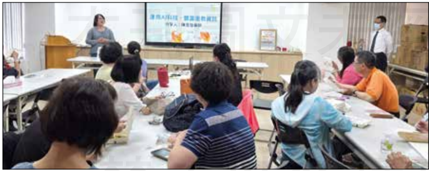
↑台南市藥師公會於6月24日舉辦「藥師分享會」首場AI實作經驗主題講座。