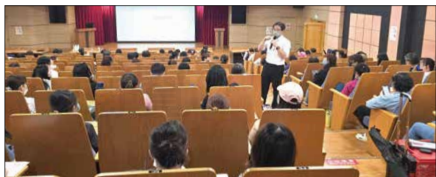
↑高雄市衛生局長照科舉辦「淨零政策-住宿型機構之用藥安全教育訓練」課程。

除此之外，學員對機構內急救車應備藥品品項、購買急救藥品越來越不容易、急救車藥品大多是過期而未曾使用等困擾也多有提及，除可依據設置辦法來調