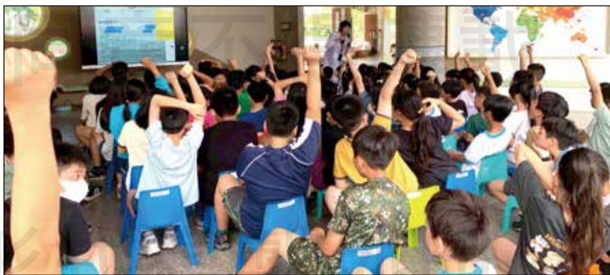
↑小朋友們搶答，現場氣氛熱烈，對於用藥安全非常有興趣。