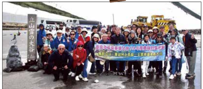
↑台南市南瀛藥師公會舉辦日本立山黑部六日遊。