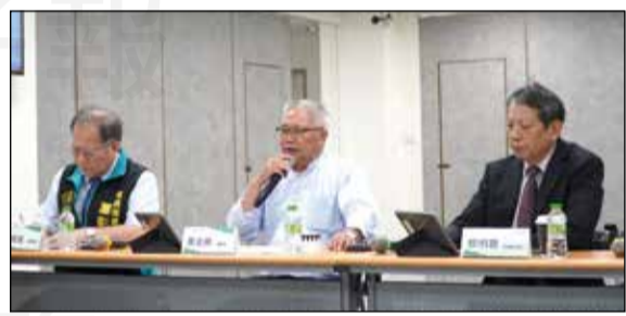
↑全聯會於7月17日召開第15屆第34次常務理監事會議，聚焦藥事制度執行現況與近期社會重大事件影響。

期盼透過藥界與政府的合作，使系統更加完善。 另外會議亦特別提及七月初颱風侵襲地區，造成部分藥局受損，全聯會對受災藥師表達高度關懷，並協助各地藥師公會掌握災後藥品供應與執業復原狀況。面對天災，全聯會持續扮演支持與溝通橋梁的角色，讓藥師在災後第一時間恢復服務，保障社區用藥不中斷。 《藥事法》第103條違法解釋爭議後續行動，決議持續快閃抗爭並與執政黨溝通協調，堅持法律尊嚴與用藥安全不容妥協，全力守護藥事制度。藥師公會全聯會持續秉持「專業、