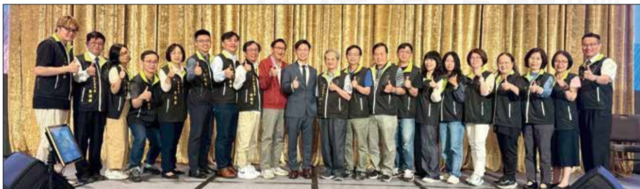
↑ 新竹縣藥師公會全體幹部大合照。