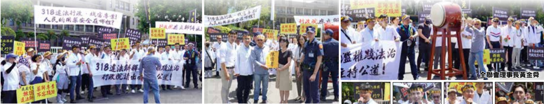
↑ 抗議衛福部違法核釋《藥事法》第103條第2項，藥師公會全聯會於7月4日號召藥師及藥學生發起「快閃行政院擊鼓申冤遞陳情書」行動。