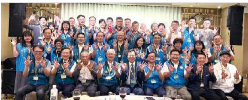
↑ 臺中市藥師公會、醫師公會舉辦醫藥合作座談。