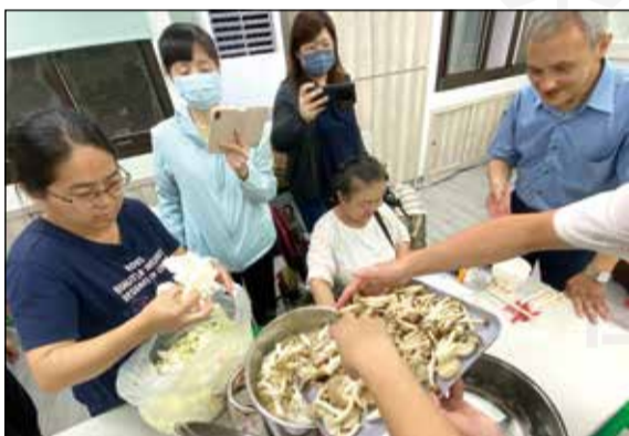
↑ 高雄市藥師公會安排「中藥腦口雙補」課程。