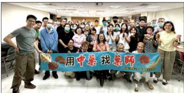
↑ 桃園市藥師公會舉辦「中草藥外用及實作基礎課程」。