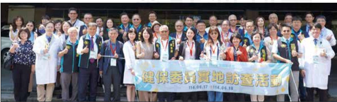
↑藥師公會全聯會於6月17、18日舉辦健保委員實地訪查活動(前排右六為健保會主委周麗芳)。

【本刊訊】為深入了解台灣藥事制度運作與藥師專業實務，藥師公會全聯會於6月17日至18日舉辦全民健康保險會委員實地訪查活動。此次行程特別安排參訪生達製藥、高雄長庚紀念醫院與高雄鳳山區中央藥局，橫跨製藥、醫院與社區三大面向。行政院政務委員陳時中亦親自參與此次行程，肯定台灣藥師與藥