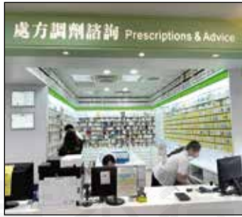
↑ 寬敞符合優良調劑作業準則(GDP)的獨立調劑區。