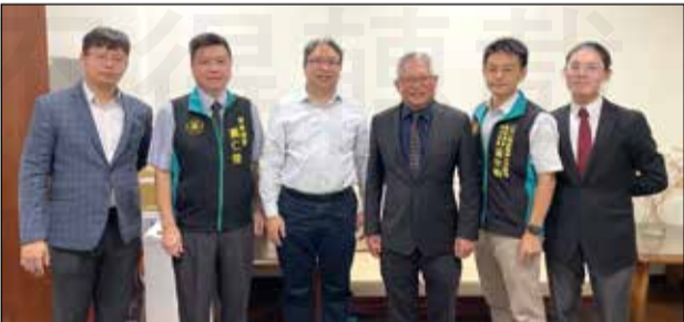
↑全聯會幹部6月20日拜會法務部政務次長黃世杰。

6月20日，拜會法務部的過程中，黃世杰表示，能夠理解目前雙方就解釋令的爭議點，也認為此類國家重大政策，應更為妥善，細緻地規劃處理。