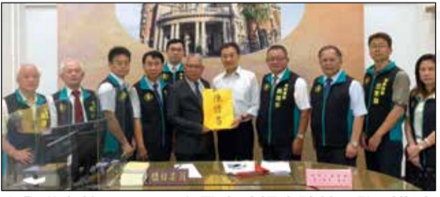
↑全聯會於6月19日向監察院提出陳情，強烈指出衛福部發布的解釋令，違法開放中藥販售資格。

【本刊訊】藥師公會全聯會於6月19日針對衛福部318發布的解釋令正式向監察院提出陳情，並於6月20日就此解釋令與藥事法第103條第2項解釋爭議拜會法務部政務次長黃世杰。