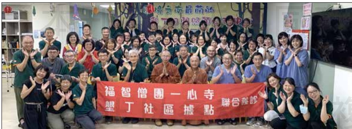
↑台南市南瀛藥師公會藥師參與「墾丁、社頂部落義診服務」。