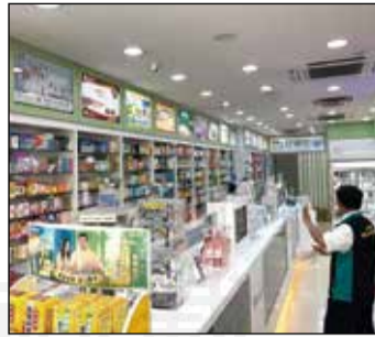
↑ 與調劑空間分流的OTC銷售產品空間。