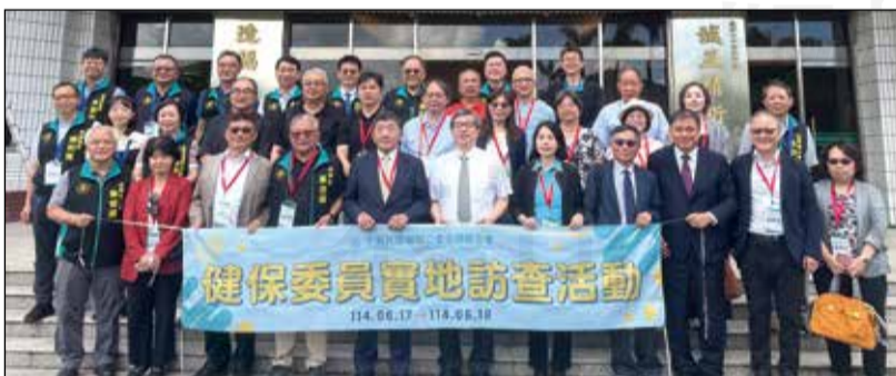
↑ 健保委員及藥師全聯會幹部參訪生達製藥(前排左五為行政院政務委員陳時中，前排中為生達製藥董事長范滋庭)。