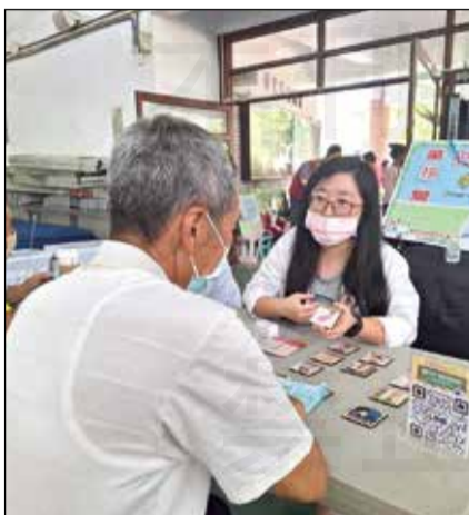
↑藥師於行動醫院活動現場，運用卡牌教材與民眾互動，指導其建立助眠好習慣。