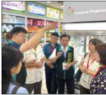
↑ 全聯會幹部針對委員的問題做補充解說。