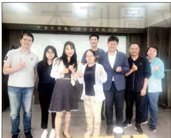
↑藥師公會全聯會於6月15日舉辦「藥事照護計畫個案討論會(進階場)」。