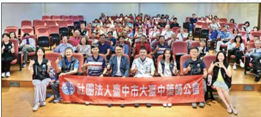
↑臺中市大臺中藥師公會於6月15日舉辦114年度會員自強活動。

此次活動充分展現大臺中藥師公會對會員活動規劃的巧思，不僅深化藥師間的交流，也為繁忙生活注入一抹溫暖與活力。期待「下一站，再相會」。