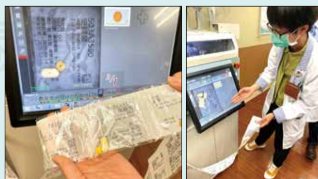
↑高雄長庚醫院智慧藥局實地訪查。