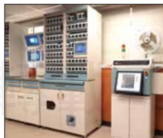
↑口服裸錠藥品智能分包暨3D影像辨識系統。