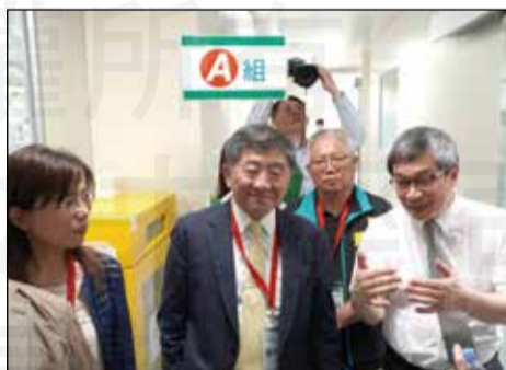
↑ 參訪生達製藥品管部。