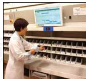
↑注射藥品智慧垂直循環調劑系統。