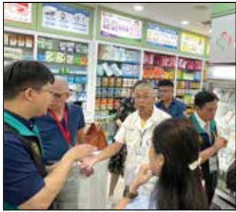
↑ 藥師和全聯會幹部回答委員的問題。