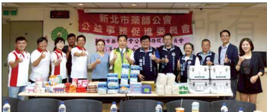
↑新北市藥師公會公益事務促進委員會發起救援物資捐贈活動。