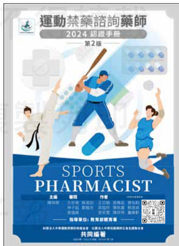
↑ 運動禁藥諮詢藥師認證手冊

根據世界運動禁藥管制機構（WADA）2025年公告的禁用清單，開放部分乙二型致效劑的吸入劑（如salbutamol、formoterol、salmeterol、vilanterol）在特定劑量下可供運動員使用。WADA於2025年修正吸入給予formoterol的開