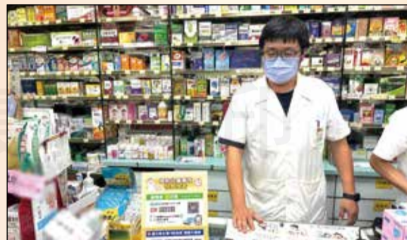
↑於藥局內宣導預防兒童事故傷害快問快答。