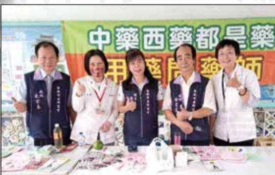
↑台南市藥師公會至國小做用藥宣導。