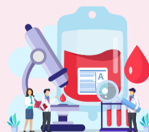
blood biochemistry test 血液生化檢查