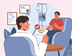
health consultation 健康諮詢

Adult health check-ups include physical exams, blood biochemistry tests, kidney function tests, and health consultations.