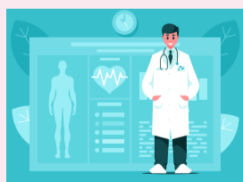
physical exam 身體檢查