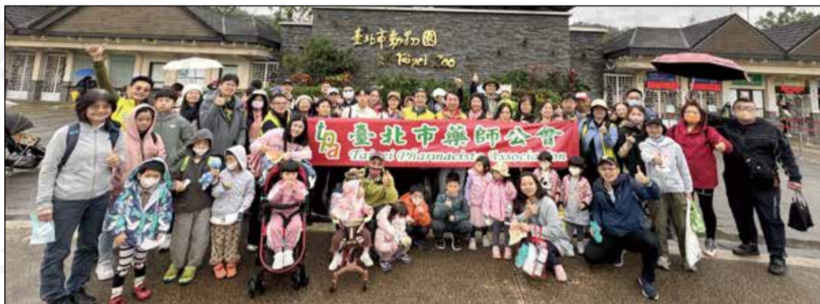
↑ 台北市藥師公會舉辦「藥師家庭親子日：藥趣動物園」活動。