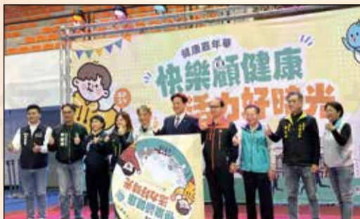
↑新竹市衛生局舉辦「快樂願健康 活力好時光」健康嘉年華活動。