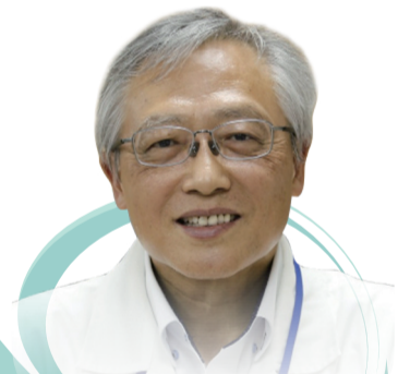
嘉義縣藥師公會理事長