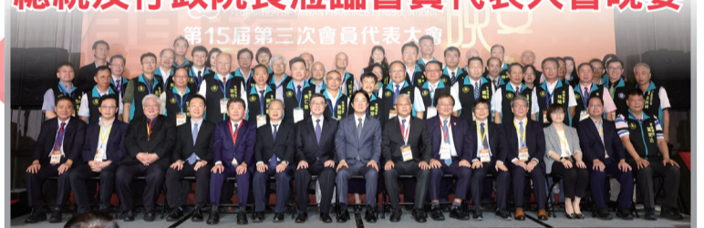
全聯會會員代表大會晚宴，總統賴清德與全聯會理監事合影。