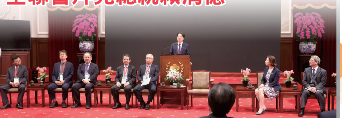
全聯會幹部拜會總統賴清德，針對社區藥局在國民健康體系中的角色進行深入交流。