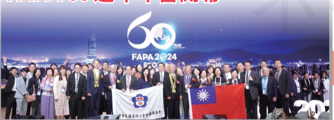
FAPA 2024年會於韓國舉行盛大開幕式。台灣有253位藥師參與盛會。