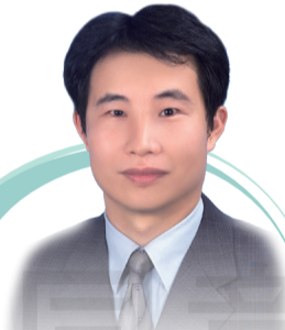
新北市藥師公會理事長

2025年本會將有更多的政策參與，更多創新的主題式活動，與自我照顧的宣導，和公共衛生的參與，讓藥事專業服務與民眾健康有更多的連結。