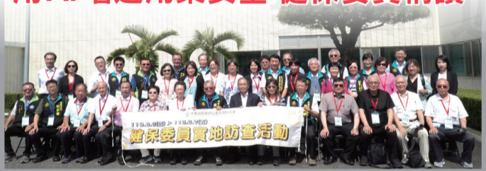
全聯會舉辦113年健保委員實地訪查醫院、藥局及藥廠。