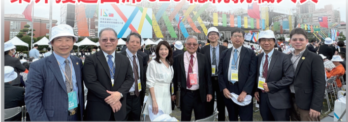
全聯會幹部受邀出席中華民國第16屆總統、副總統宣誓就職典禮。