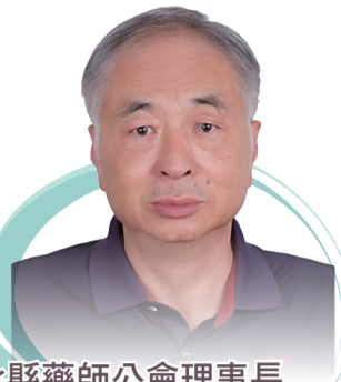
彰化縣藥師公會理事長