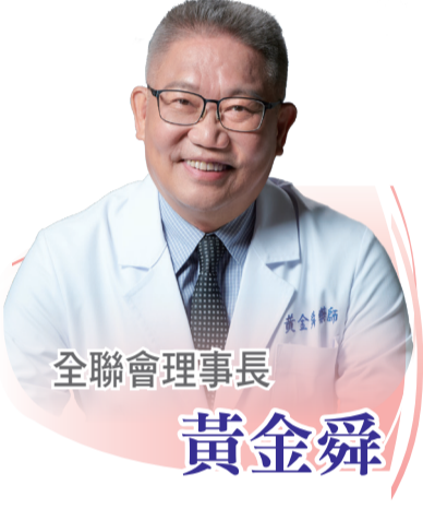
全聯會理事長 黃金舜