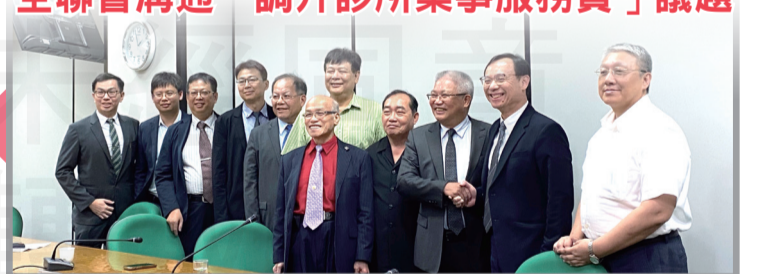
就「調升診所藥事服務費」議題拜會健保署長石崇良。