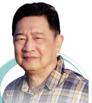
雲林縣藥師公會理事長