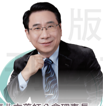
臺北市藥師公會理事長