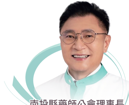
南投縣藥師公會理事長