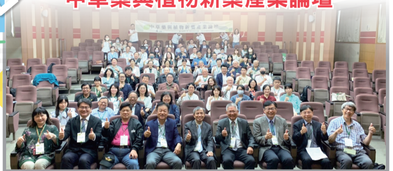
全聯會參與中草藥與植物新藥產業論壇，說明「藥師是藥的專家」藥不分中西。