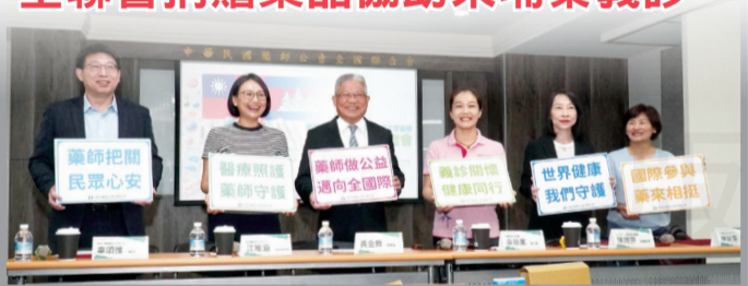
全聯會攜手台灣希望之芽協會做公益，進行藥品捐贈。