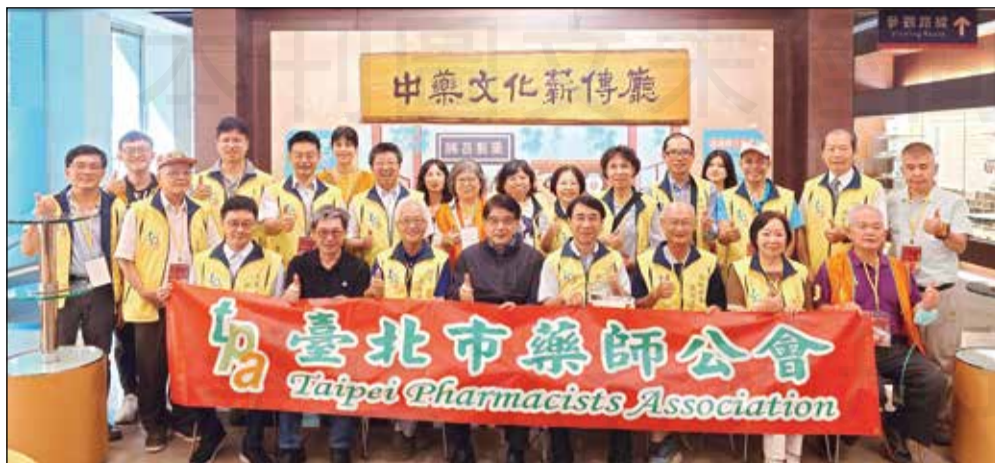
↑臺北市藥師公會舉辦參訪中藥廠。