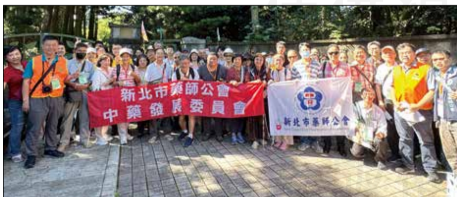
↑新北市藥師公會舉辦「台北植物園與迪化街參訪一日活動」。