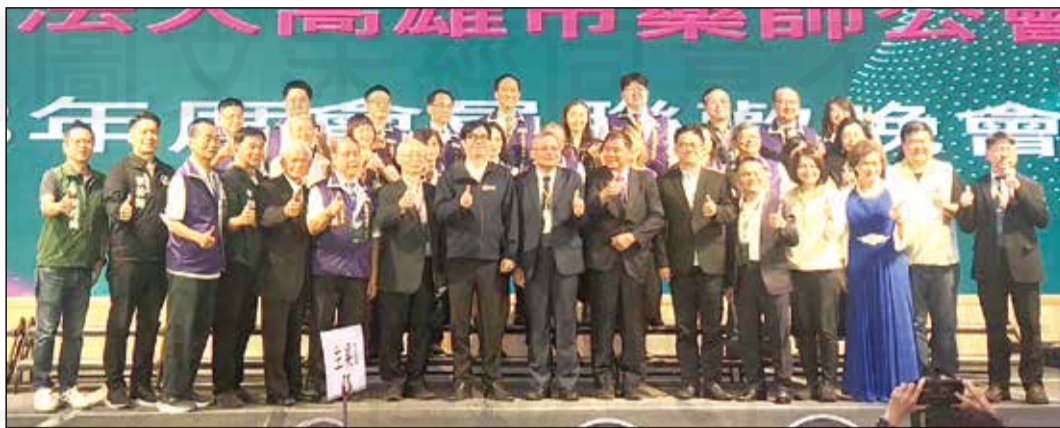
↑ 高雄市藥師公會於11月3日舉辦113年會員聯歡晚會。高雄市長陳其邁（前排右7）蒞臨會場肯定藥師的付出。