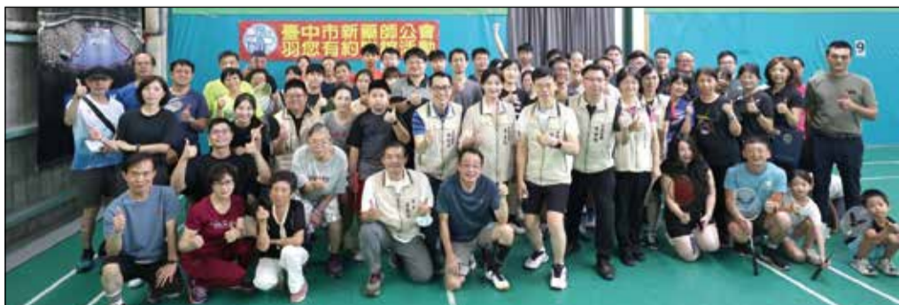
↑臺中市新藥師公會舉辦第一屆「羽您有約」羽毛球聯誼賽。