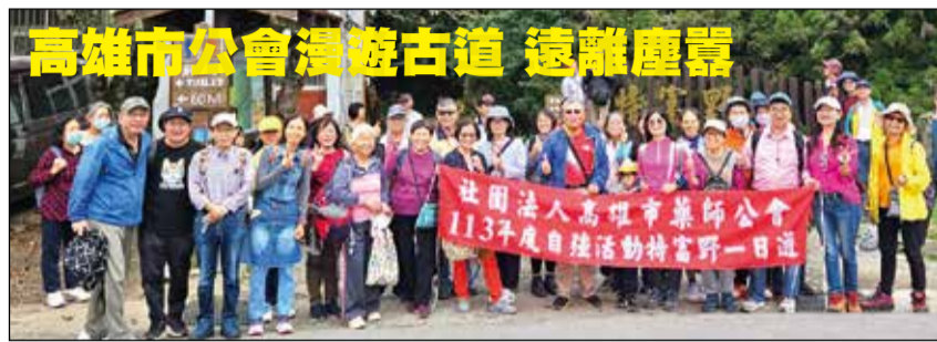
↑ 高雄市藥師公會舉辦113年度會員自強活動一日遊。