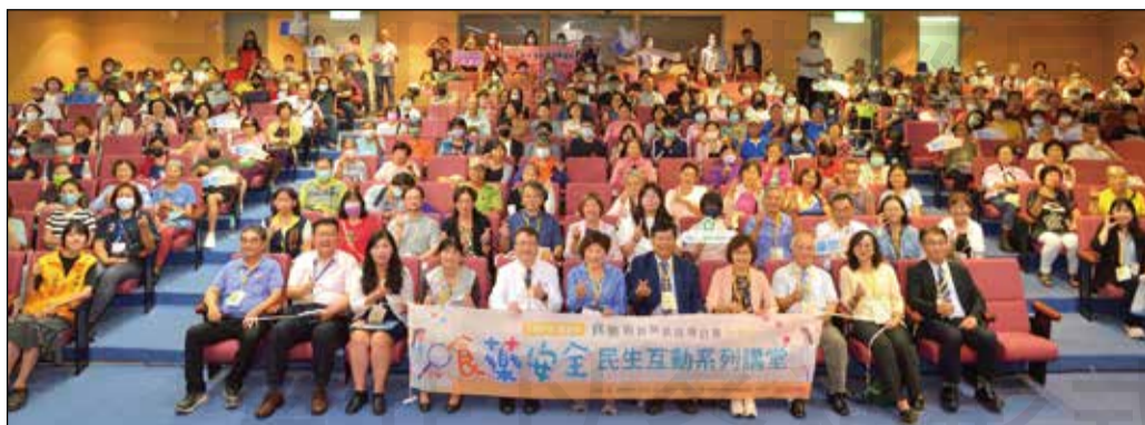
↑嘉義市政府衛生局與嘉義市藥師公會舉辦「食藥安全民生互動系列講堂」。