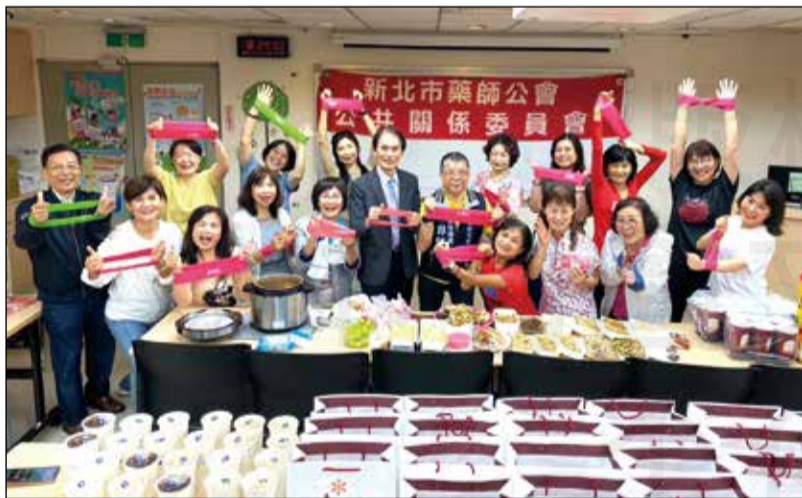
↑ 新北市藥師公會成立「公共關係委員會舞蹈班」。