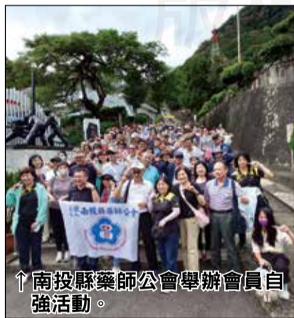
↑ 南投縣藥師公會舉辦會員自強活動。

時間飛逝已近黃昏，晚上餐敘品嚐特殊風味的料理，就在大家聊的意猶未盡，快樂氛圍下結束一天的行程，期待明年舉辦的二日遊，讓大家更有時間互相交流。