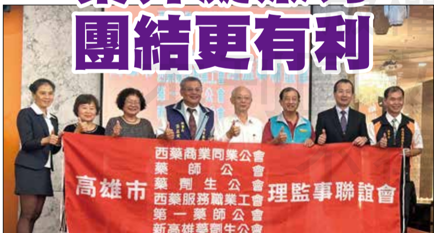
↑高雄市藥界理監事聯誼餐會。