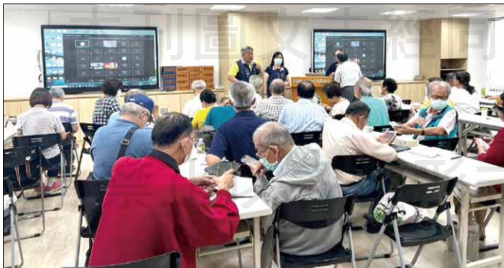
↑台南市藥師公會舉辦針對多項臨床營養與藥物應用的繼續教育課程。