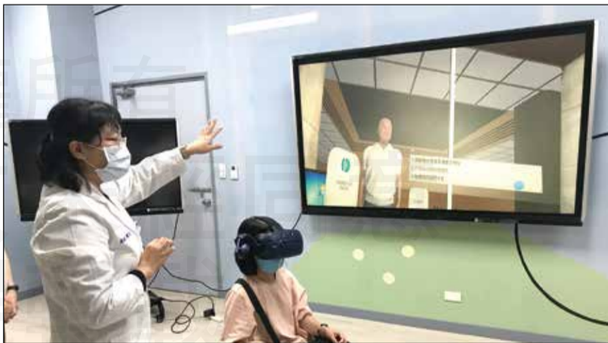
↑ 台南市藥師公會醫院藥事委員們體驗成大醫院虛擬實境的教學。