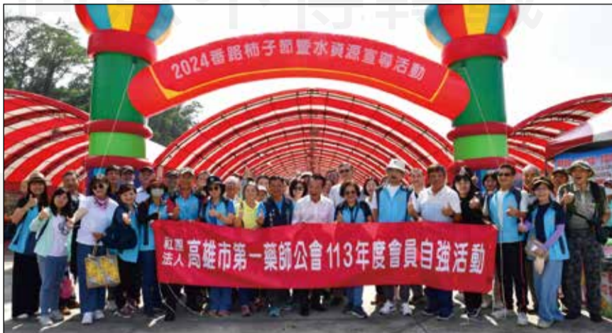
↑ 高雄市第一藥師公會舉辦一年一度的自強活動。(嘉義縣長翁章梁及番路鄉長蕭博勝與藥師合影。)