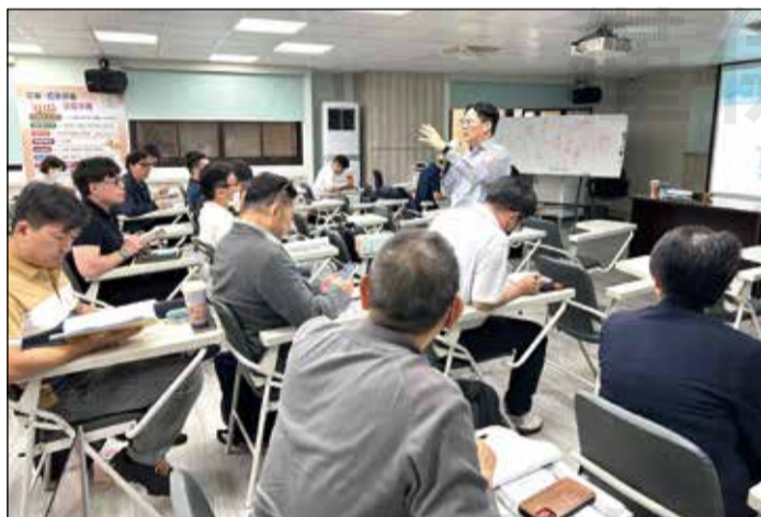
↑「藥局經營力總檢視」講座。