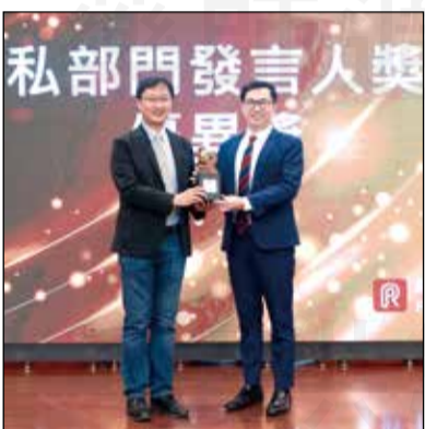
↑全聯會理事長黃金舜(左圖右)與發言人黃彥儒(右圖右)，分別榮獲財團法人公共關係基金會2024傑出公關獎-CEO形象獎、發言人獎，並於9月4日出席頒獎典禮。

【本刊訊】藥師熱衷公共事務！藥師公會全聯會理事長黃金舜榮獲財團法人公共關係基金會2024傑出公關獎-CEO形象獎、發言人黃彥儒榮獲2024傑出公關獎-發言人獎殊榮，並於9月4日出席頒獎典禮。