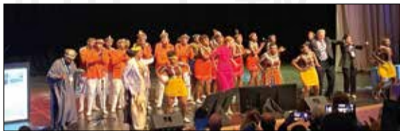
↑ 南非傳統表演團體 Isibane Se Afrika 邀請 FIP 理事長與執行長一同共舞。