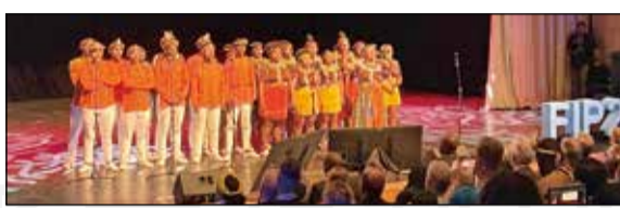
↑ 邀請來賓大合唱南非的國歌《Nkosi Sikelel' iAfrika》，是一首祈求上帝保佑非洲的歌。

FIP 近期推出的「思健康，思藥學」(Think Health, Think Pharmacy) 全球活動，旨在提升藥學在全球健康中的重要角色，推動藥師在醫療保健中的貢獻：人工智慧、共享電子健康紀錄、自動化配藥系統、個性化治療計畫、遠距藥學及疫苗施打等。FIP 致力於強化藥局作為健康服務提供場所的角色，並推動藥師在初級醫療照護中的作用，以實現全球全民藥學覆蓋的目標。他呼籲所有藥師和專業人士以誠信、績效和熱情推動職業的進步，並在全球健康事業中發揮更大的作用。