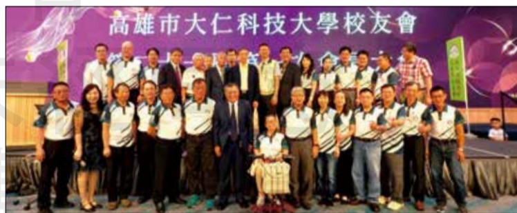
↑高雄市大仁科技大學校友會舉辦第廿一屆第一次會員大會。