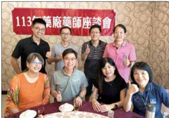
↑新竹縣藥師公會舉辦藥廠藥師座談會。