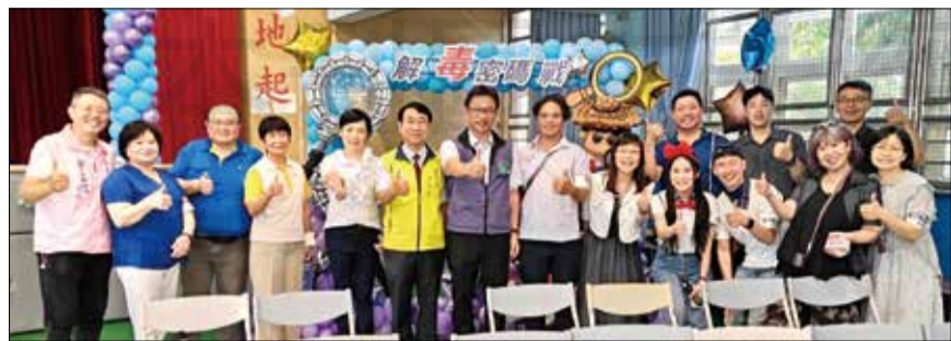
↑臺北市立聯合醫院藥劑部、臺北市藥師公會舉辦「解毒密碼戰」活動。

◎文／台北市記者蘇柏名 由臺北市立聯合醫院藥劑部主辦、臺北市藥師公會協辦之「解毒密碼戰」活動於8月11日於萬大國小舉辦，為配合市府衛生局之「暑期青春專案」，特地於暑假期間辦