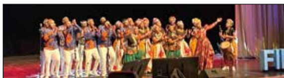
↑ 南非傳統表演團體 Isibane Se Afrika 的表演情緒充沛，讓所有與會者紛紛隨之起舞同歡。