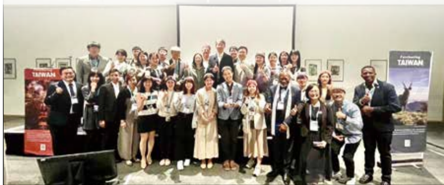
↑ 臺灣藥師代表與國外藥師大合照。