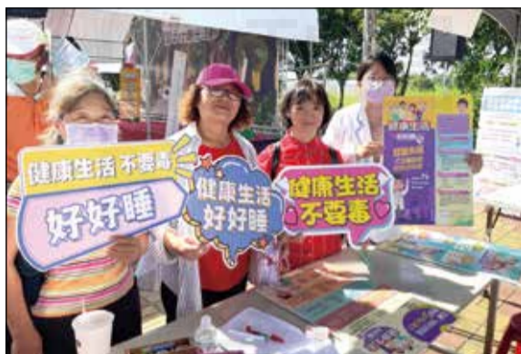
↑柳營奇美醫院於「食農教育體驗暨文化活動」設攤，進行用藥安全宣導。