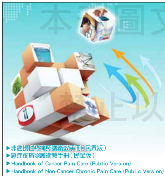
▶ 非癌慢性疼痛照護衛教手冊(民眾版) ▶ 癌症疼痛照護衛教手冊(民眾版) ▶ Handbook of Cancer Pain Care (Public Version) ▶ Handbook of Non-Cancer Chronic Pain Care (Public Version)