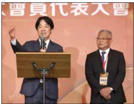
↑藥師公會全聯會於7月14日舉辦會員代表大會晚宴，總統賴清德、行政院長卓榮泰率領衛福部團隊親臨會場，並與全聯會理監事合影。

【本刊訊】藥師公會全聯會於7月14日舉辦會員代表大會，全國各地藥師蒞臨出席，會後晚宴，總統賴清德、行政院長卓榮泰以及衛福部長邱泰源、食藥署長莊聲宏等長官均蒞臨現場相挺藥師，這也是520新政府上台後，第一次參與藥界盛會，理事長黃金舜也向新政府喊話，希望能進行相關健保、藥政改革。