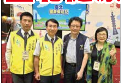
↑ 臺北市藥師公會與各醫事團體攜手「臺北健康養成記」系列活動，呼籲市民共同來參與。