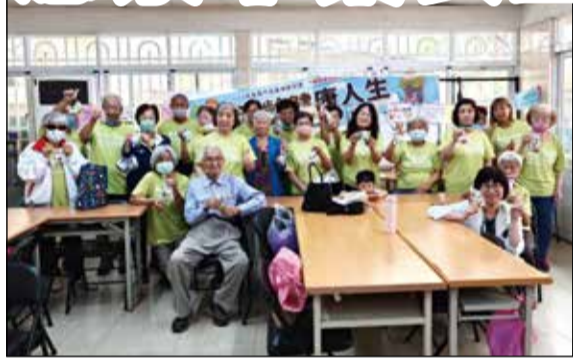
↑嘉義基督教醫院藥師教導阿公阿嬤中藥用藥安全觀念。