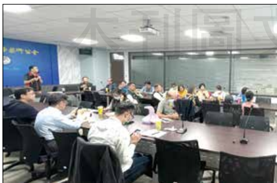
↑臺中市藥師公會於112年12月6日舉辦2023年世界藥學會(FIP)及亞洲藥學會(FAPA)兩大重要年會的經驗傳承活動。