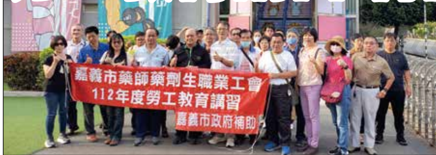
↑嘉義市藥師生職業工會舉辦勞工教育訓練暨會員聯誼。