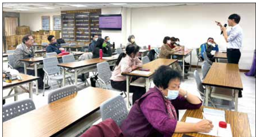
↑ 桃園市藥師公會於112年12月16日舉辦診所藥師繼續教育課程。