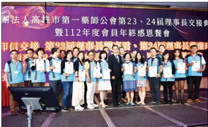
↑ 高雄市第一藥師公會於112年12月17日舉辦112年度的會員年終聯歡會。