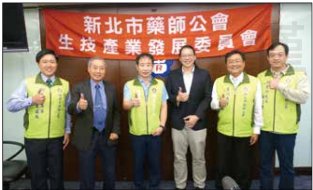
↑新北市藥師公會於12月12日舉辦生技產業再生醫療產品發展趨勢研討會。