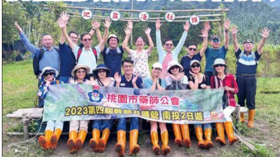
↑桃園市藥師公會第4屆幹部共識營，於9月16、17日在中彰投舉行。