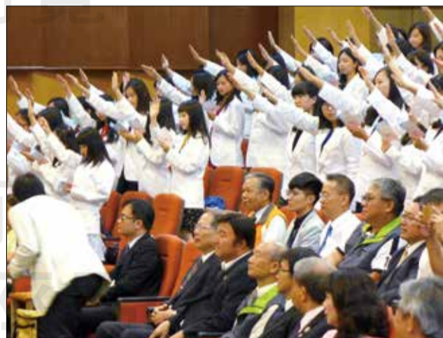
↑「提高藥師國考錄取率」才是最彈性、最具伸縮性的解決方法，而非一再開放大學增設藥學系。

所以，「提高藥師的國考錄取率」是最彈性、具伸縮性的解決方式，而非一再開放大學增設藥學系，甚至來者不拒的一直開放下去。