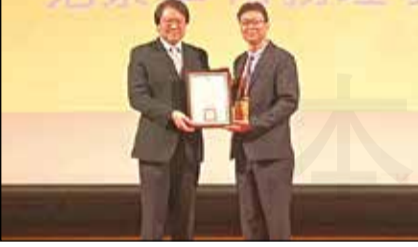
↑內政部長林右昌(左)9月15日頒發「優等團體」獎予藥師公會全聯會，由常務理事范景章(右)代表受獎。

【本刊訊】內政部於9月15日舉辦「112年全國性社會團體公益貢獻獎及績優職業團體表揚大會」，行政院長陳建仁、部長林右昌蒞臨盛會，頒獎表揚50個人民團體，藥師公會全聯會獲頒優等團體獎。行政院長陳建仁致詞時表示，人民團體是政府重要夥伴，