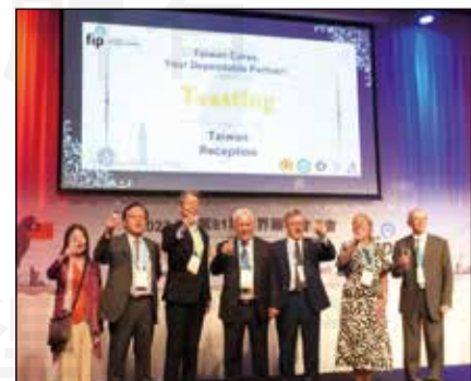
↑9月25日，由台灣藥學會、臺灣臨床藥學會和台灣年輕藥師學會共同主辦的Taiwan Reception順利舉行。

這次的FIP大會不僅是一個學術交流的平台，更是一個促進國際藥學界友誼和合作的重要場合。參與者們透過此平台，不僅能夠學習到最新的藥學知識和技術，還能夠擴大自己的國際視野和人脈網絡，為未來的藥學發展和國際合作奠定堅實的基礎。