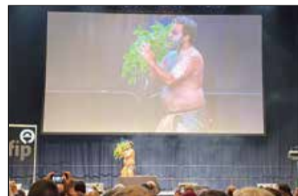
↑Moreton Island 原住民族演出。