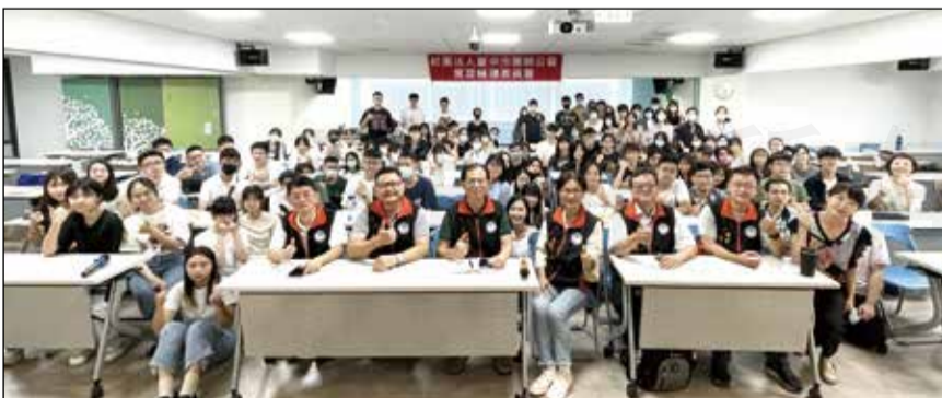
↑台中市藥師公會於8月25日安排藥學生成果發表。