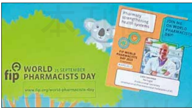
↑ 世界藥師節(WPD)每年9月25日。