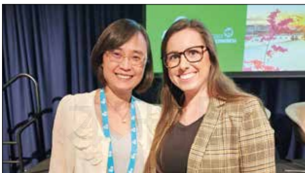
↑ 台灣藥師與講者 Whitley Yi (右) 博士合影。

總結而言，這些新的規範和觀點，不僅改變藥師專業實踐的日常運作，也提升在整體醫藥領域的重要性。