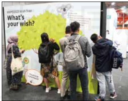
↑ 在FIP大會歡迎晚宴上，參加者在「願望樹」表達對WPD願望。