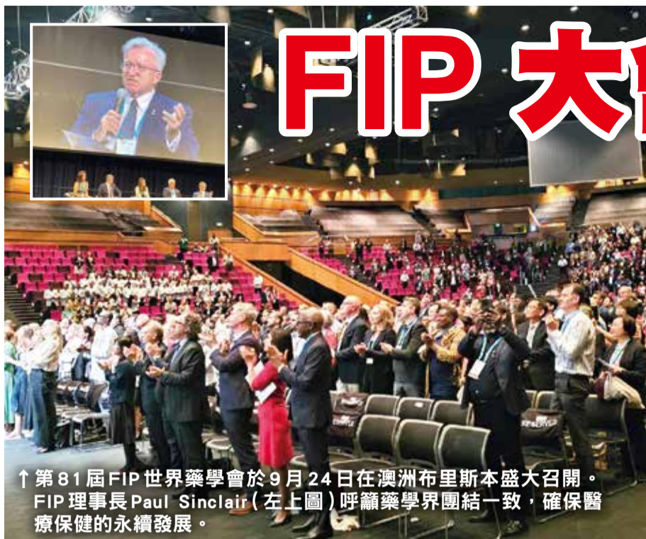
↑第81屆FIP世界藥學會於9月24日在澳洲布里斯本盛大召開。FIP理事長Paul Sinclair(左上圖)呼籲藥學界團結一致，確保醫療保健的永續發展。