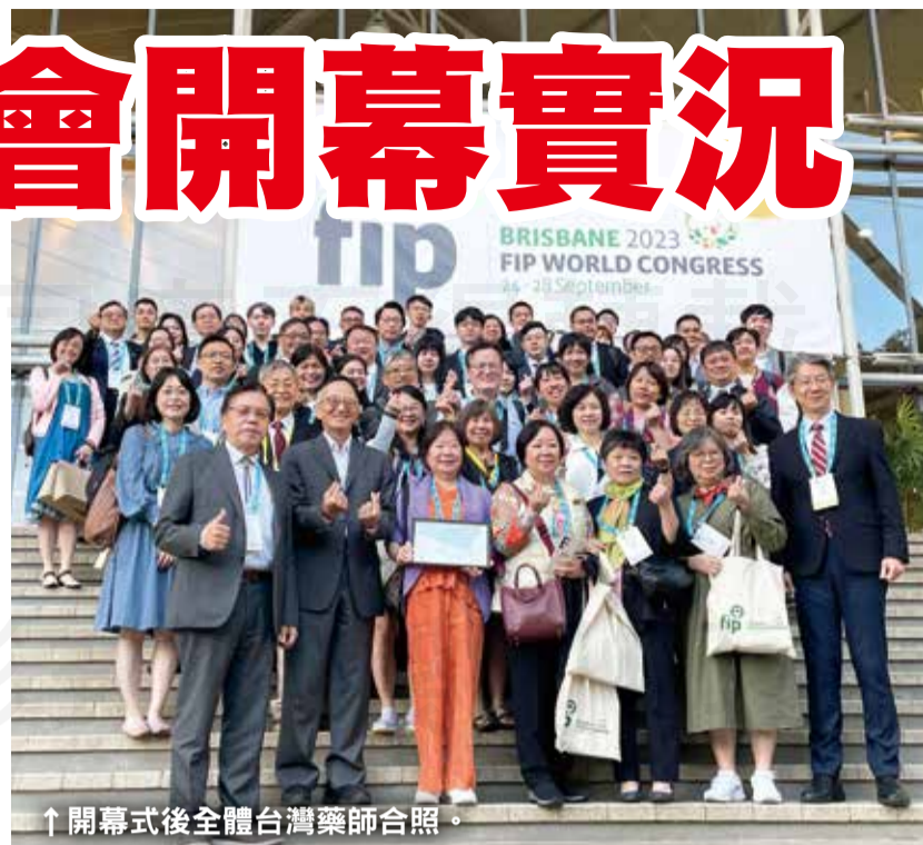
↑開幕式後全體台灣藥師合照。