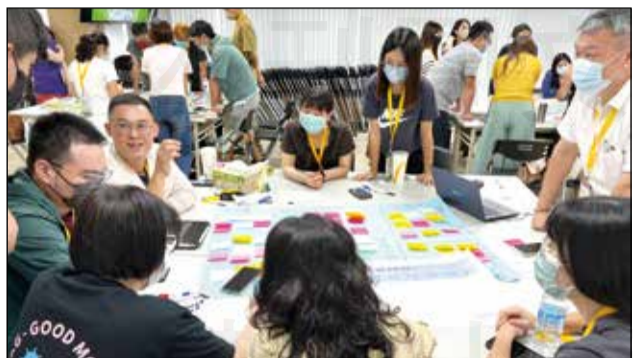
↑藥師公會全聯會舉辦「112年中藥實習指導師資教學培訓課程」台南場於8月20日在台南市藥師公會舉辦。