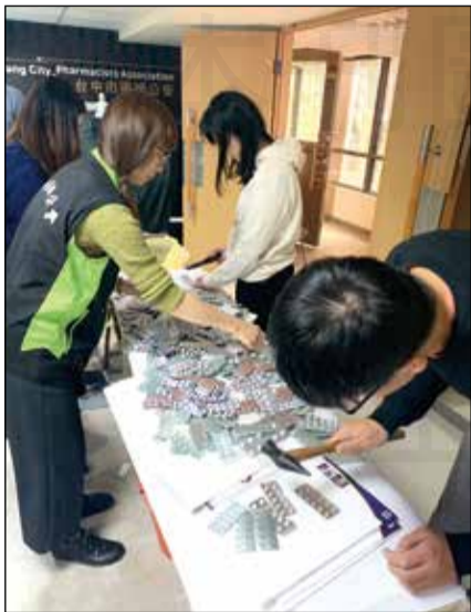
↑管制藥品有其特殊性，過期品的處理過程也更為嚴格複雜。