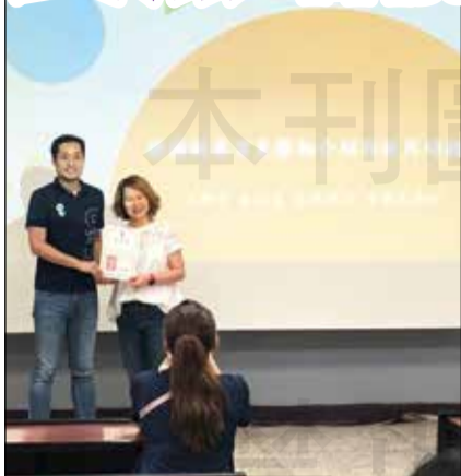
↑ 高雄市衛生局於8月20日進行長照專業人員增能教育訓練。