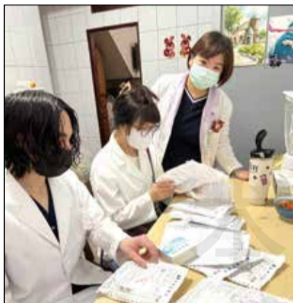
↑ 醫院實習時，希望學生可以了解病人在家的實際用藥，會在實習課程中安排居家訪視。