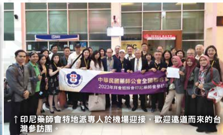
↑印尼藥師會特地派專人於機場迎接，歡迎遠道而來的台灣參訪團。