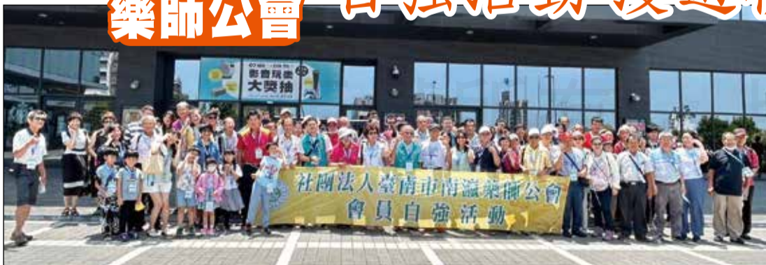
↑台南市南瀛藥師公會會員自強活動於8月6日歡喜出航。