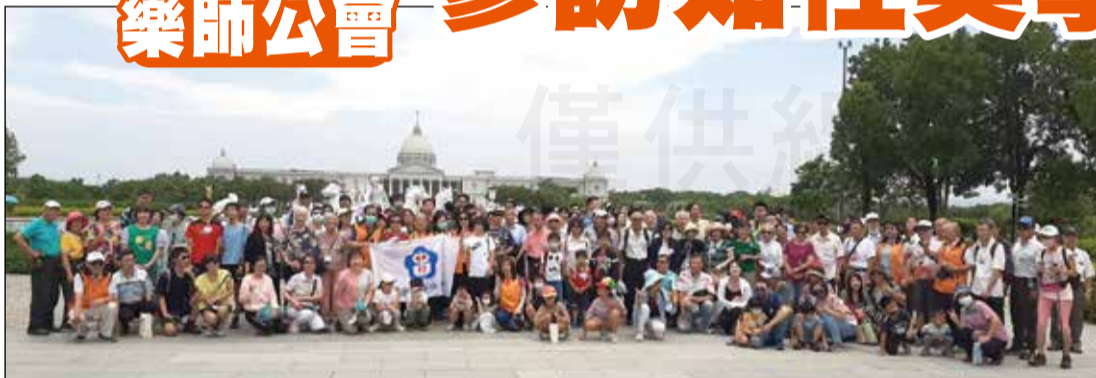
↑彰化縣藥師公會舉辦知性美學奇美之旅。