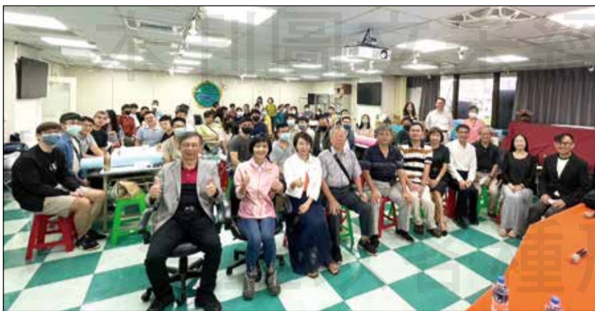
↑大仁科技大學藥學系於今年8月的四個週日舉辦「社區藥局指導藥師課程」。