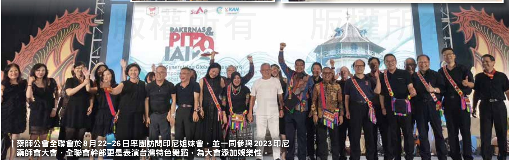
↑藥師公會全聯會於8月22~26日率團訪問印尼姐妹會，並一同參與2023印尼藥師會大會，全聯會幹部更是表演台灣特色舞蹈，為大會添加娛樂性。