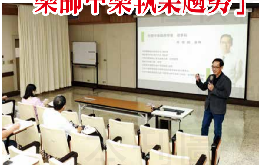
↑雲林縣藥師公會於8月20日舉辦中藥繼續教育課程講座。