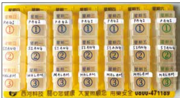
↑社區藥局藥師貼心地藥盒寫上外籍看護熟悉的文字，使長者服藥更順暢。