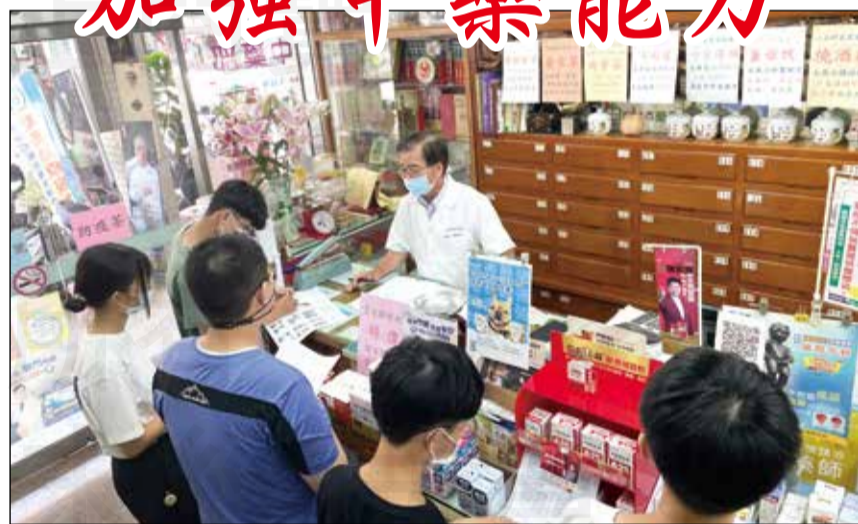
↑臺中市藥師公會實習輔導委員會，安排中西藥局實作課程實習，讓中藥實習學生學習中藥。