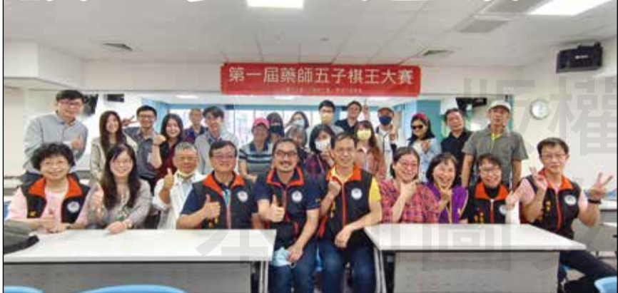
↑臺中市藥師公會於會館舉辦「第一屆藥師五子棋王大賽」。