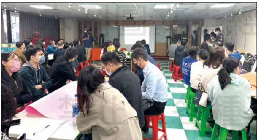
↑「111年度社區藥局實習指導藥師培訓工作坊」高雄場，期盼提升藥學生實習品質提升，以孕育藥界未來人才。