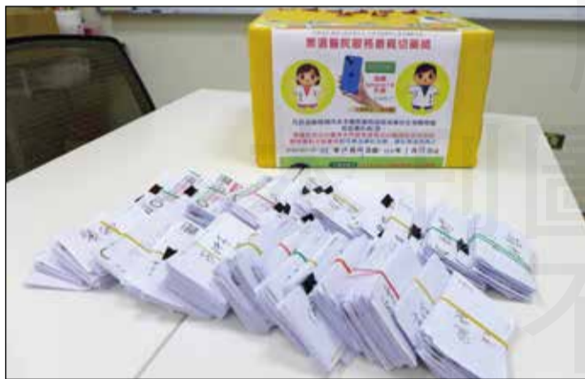
↑台南市藥師公會首次舉辦由民眾投票選出台南市各大醫院服務最親切藥師。