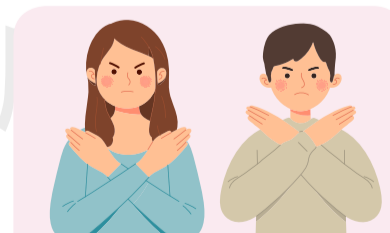
out of reach 拿不到

The better form of medication for children is liquid rather than powder . The medications should be taken with water, and kept out of reach of children. 兒童用藥選擇液劑比磨粉好。服藥記得配水，且藥品一定要放在兒童拿不到的地方。