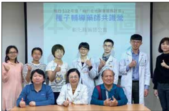
↑彰化縣藥師公會舉辦長照種子講師培訓。