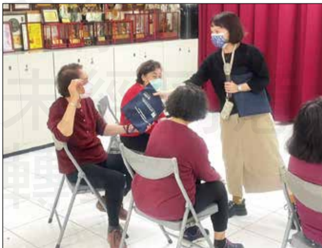
↑醫院藥師走入社區宣導銀髮族正確用藥觀念。