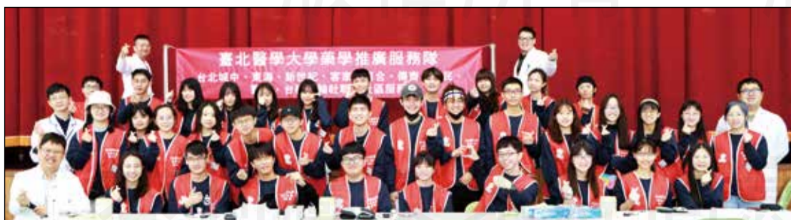
↑臺北醫學大學藥學推廣服務隊於2月4日在雲林縣東勢國小展開下鄉專業愛心服務。