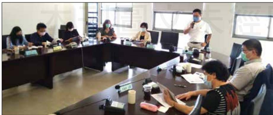
↑苗栗縣藥師公會承接今年度食品藥物管理署的「執行在地藥事服務計畫」，並於3月23日召開首場籌辦會議。