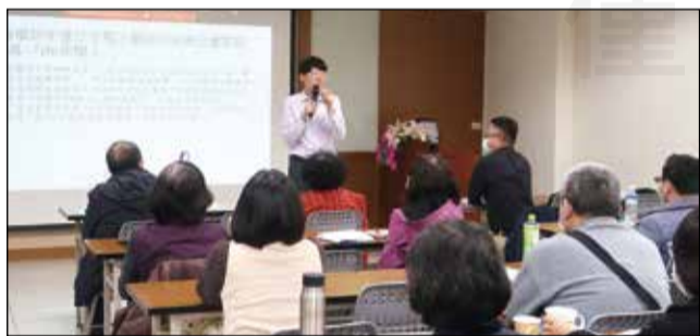
↑桃園市藥師公會診所藥師委員會於3月19日舉辦專業與法規並重的繼續教育課程。