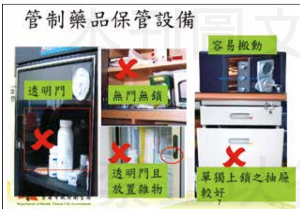
↑管制藥品保管設備常見的錯誤方式。