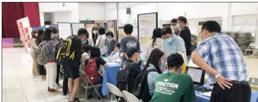
↑嘉南藥理大學藥理學院於5月3~5日舉辦「2021校園徵才博覽會」。