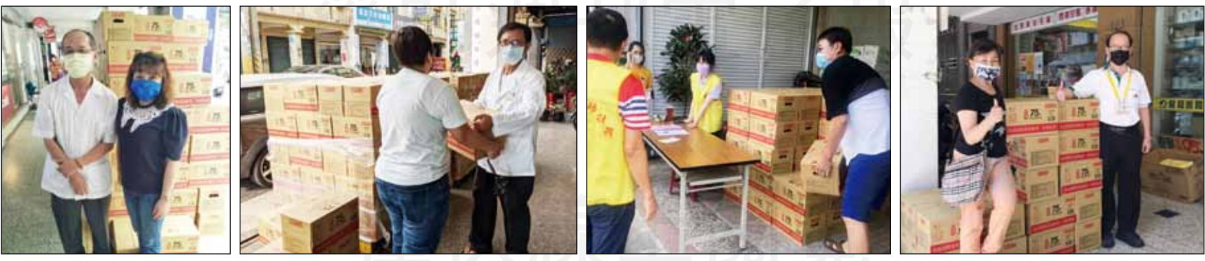
↑為穩定防疫酒精的供應與價格，全聯會於5月18日開始執行「防疫酒精穩定計畫」，各縣市陸續收到防疫酒精，藥師與全民一起挺過疫情。

【本刊訊】近日因疫情升溫，防疫酒精需求大增，加上物流量能吃緊，市場供應與價格均呈不穩。不只民眾不易買到酒精，甚至連最貼近民眾的社區藥局與中盤商，也面臨叫不到貨的窘境，更傳出有不少不肖人士哄抬價格。 為穩定防疫酒精的供應與價格，藥師公會全聯會於5月18日