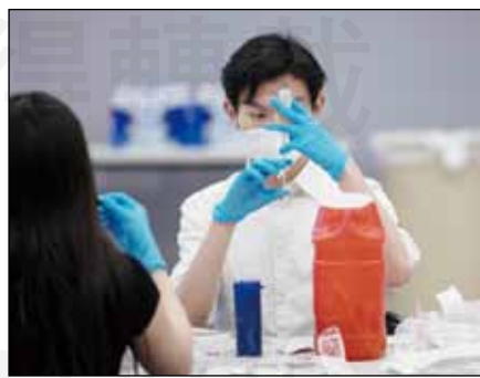
↑人力吃緊下，藥學生協助藥師抽取COVID-19疫苗。