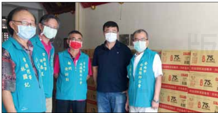
↑台南市南瀛藥師公會5月26日取得防疫酒精。