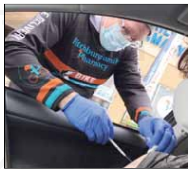
↑美國民眾開車到社區藥局旁邊，不用下車，由藥師直接到車邊施打新冠疫苗。