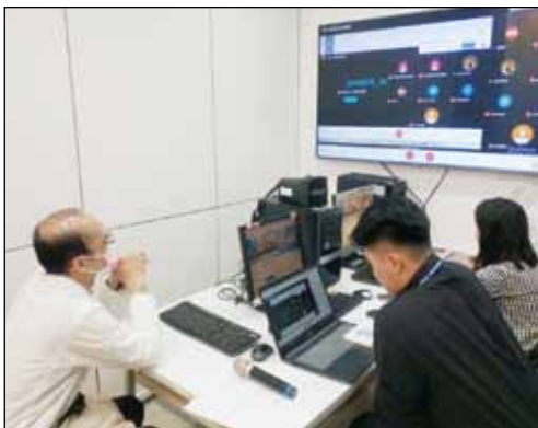
↑疫情期間改用視訊方式進行臨床病歷討論(包括醫師、藥師、臨床藥學研究生、藥學系教授等。)