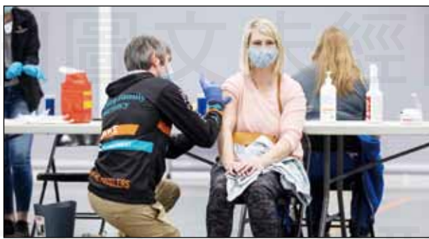
↑美總統拜登號召藥師參與施打疫苗，是全美施打率上升到38%的關鍵。(場景為美國community center)