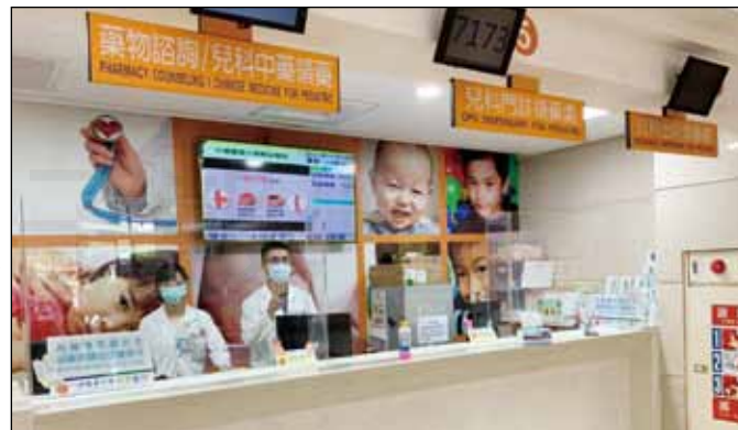
↑在藥局發藥櫃檯設置壓克力隔板保護藥師及病人的安全。